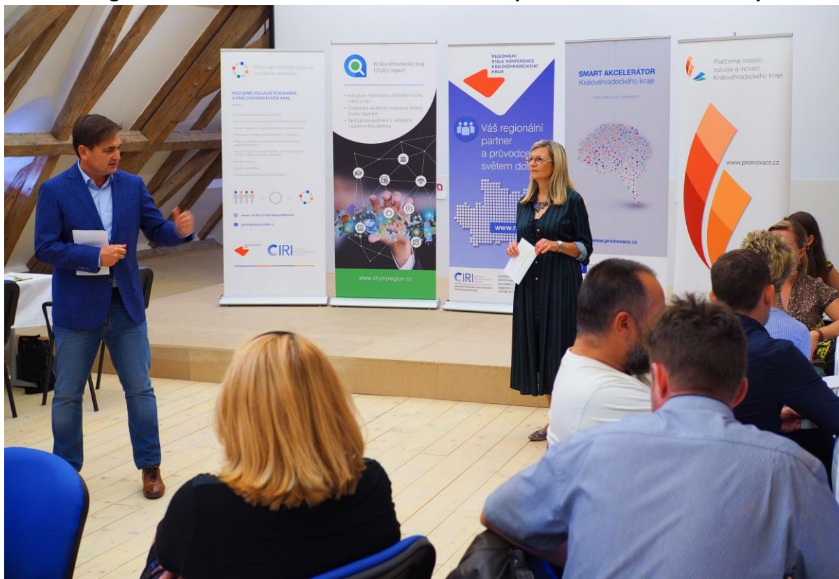
Obr. 7 Fotografie z kulatého stolu RSK KHK k rolím RSK po roce 2020 ze dne 30. srpna 2018