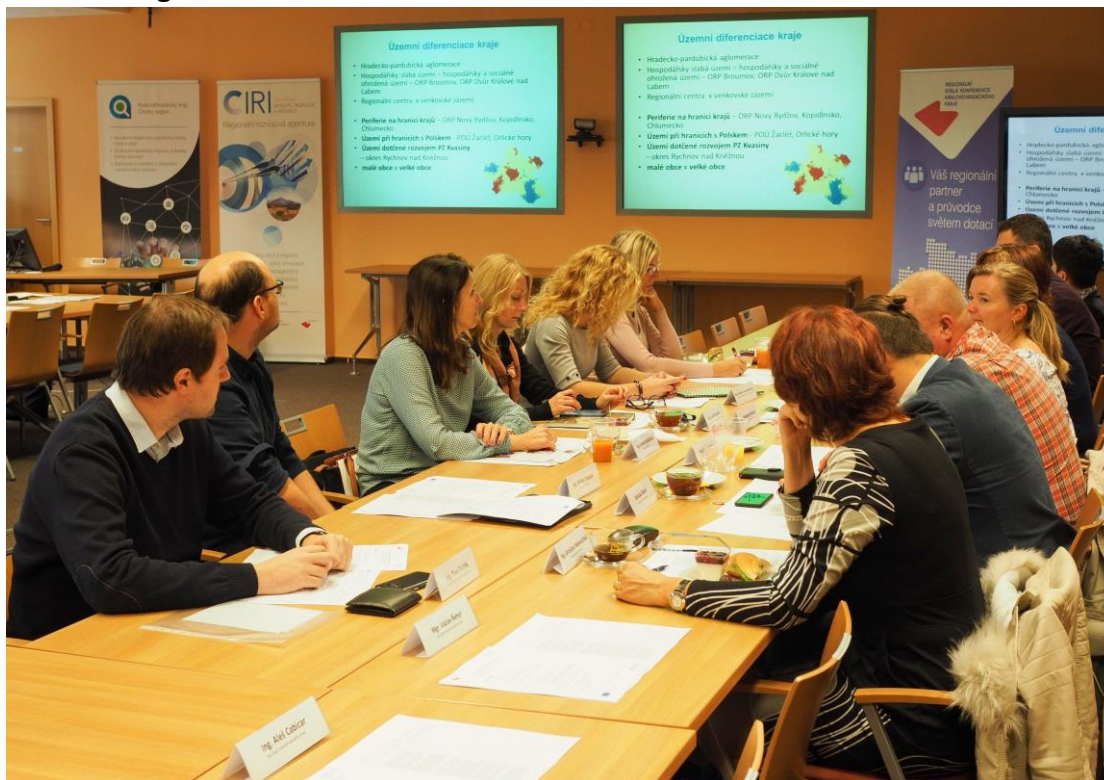
Obr. 3 Fotografie ze 13. zasedání RSK KHK