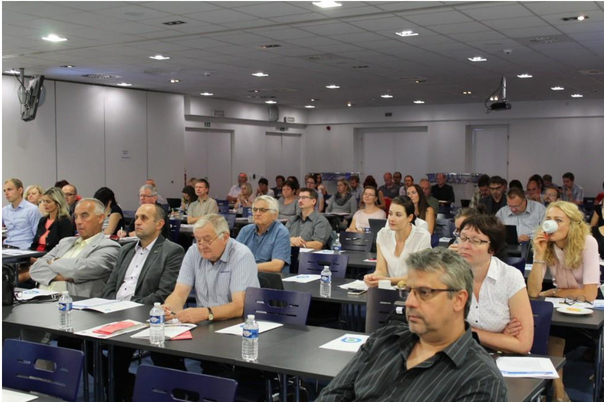
Obr. 11 Fotografie z konference Příležitosti pro region 2018

Výstupy z panelové diskuze byly 4. října 2018 prezentovány RSK KHK na jejím 13. zasedání.