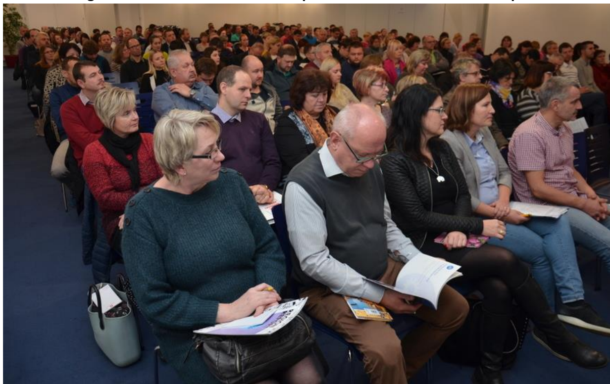
Obr. 12 Fotografie ze semináře Nové dotace pro obce na rok 2019 ze dne 5. prosince 2018