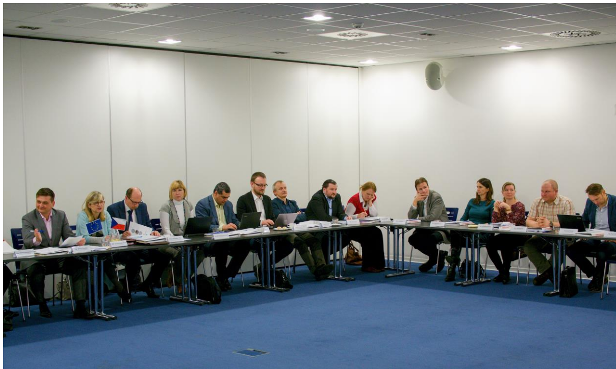
Obr. 1 Fotografie z 11. zasedání RSK KHK