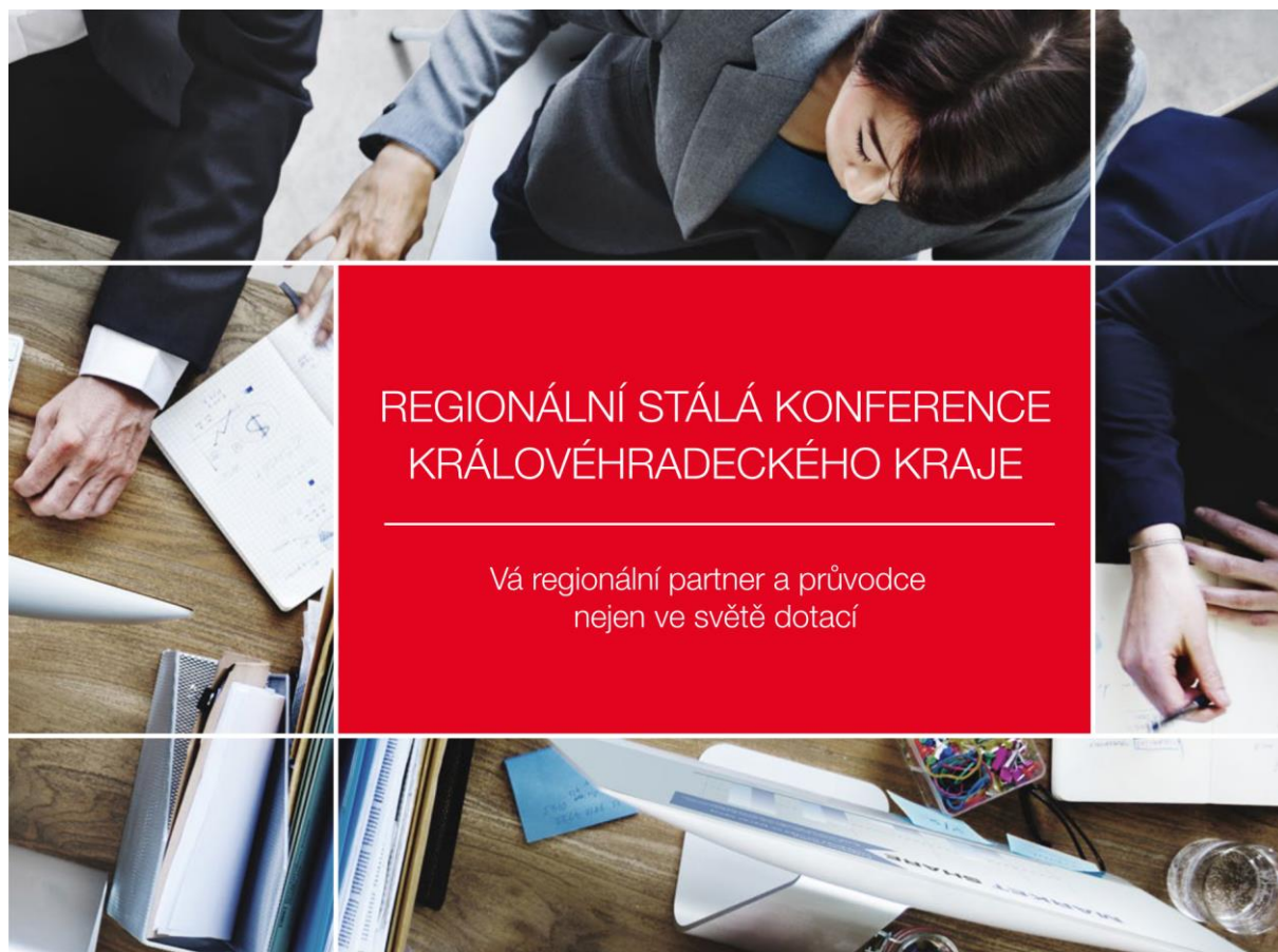
Obr. 13 Brožura RSK KHK – titulní strana

RSK KHK se viditelně prezentuje informační brožurou, informačními letáky a roll-upem na všech akcích, které její sekretariát organizuje či spolupořádá. Sekretariát RSK pravidelně aktualizuje internetové domény www.rskkhk.cz a www.chytryregion.cz , které společně s emailovou komunikací slouží jako hlavní informační kanál o aktivitách RSK KHK v regionu.