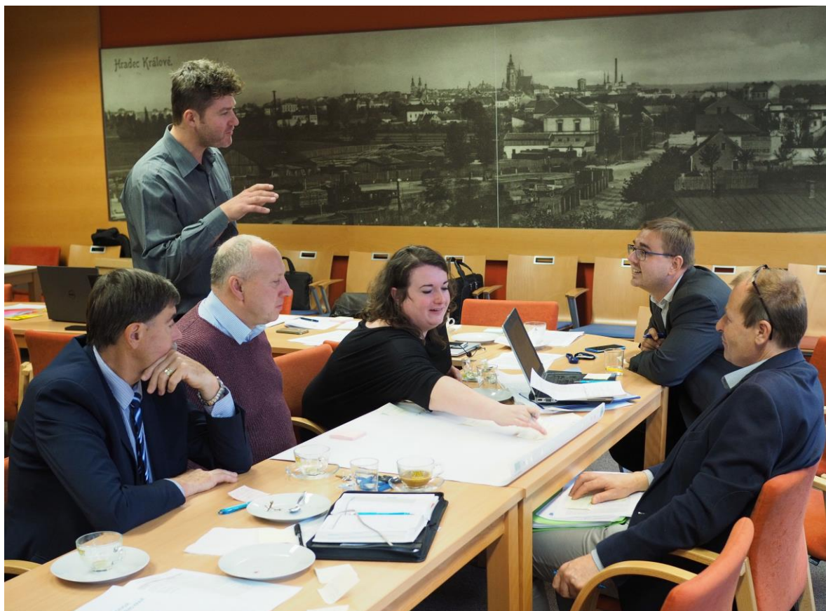
Kulatý stůl RSK KHK