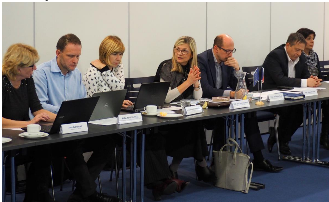
Obr. 4 Fotografie ze 14. zasedání RSK KHK