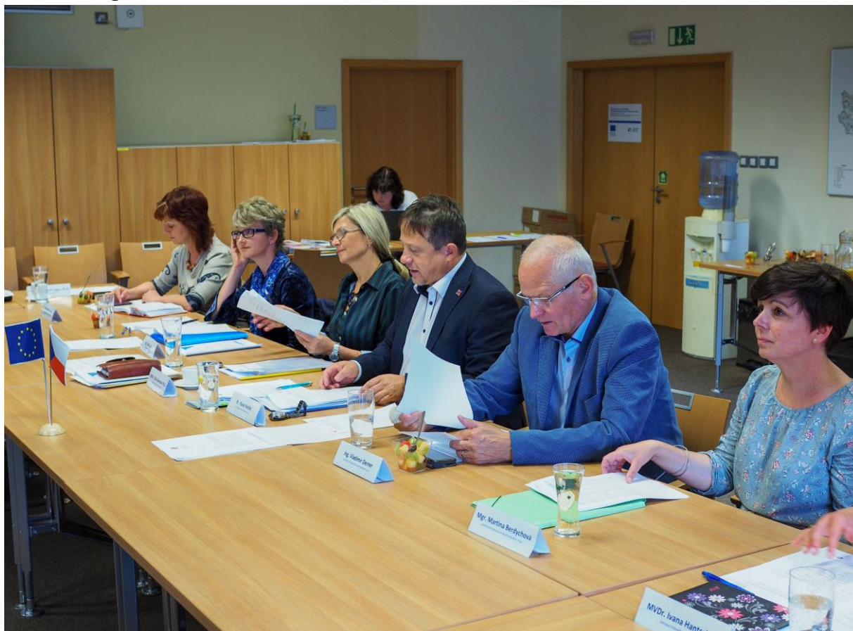
Obr. 2 Fotografie ze 12. zasedání RSK KHK