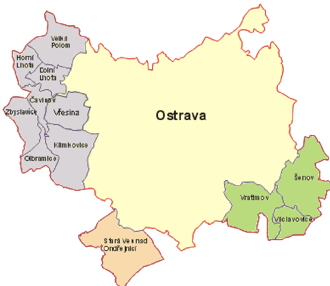
Obrázek 1 Mapa řešeného území

Uvedených 12 obcí, kromě statutárního města Ostravy, je tvořeno celkem 14 katastrálními územími. Výměra řešeného území čítá 331,51 km 2 .