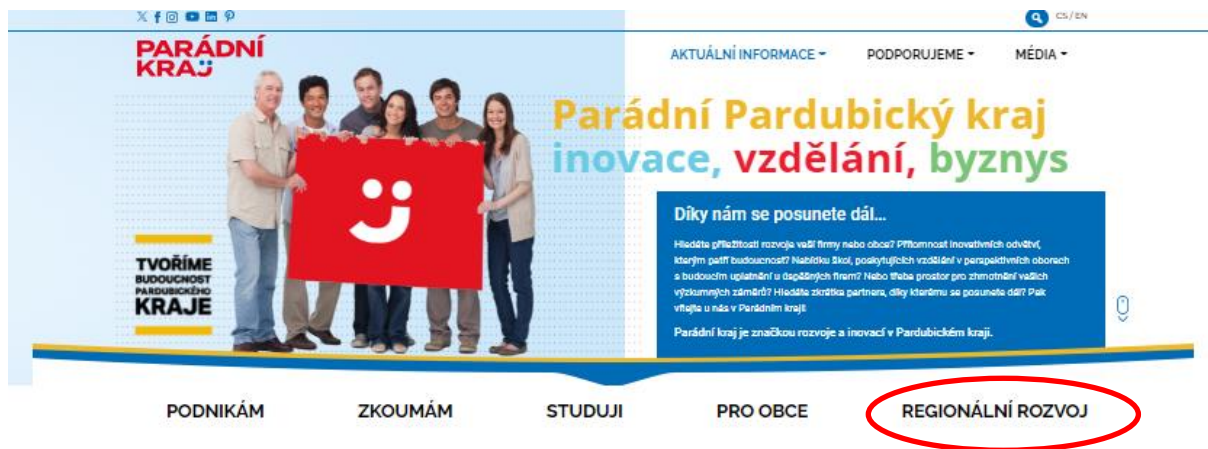
Obrázek 1: Webové stránky www.paradnikraj.cz