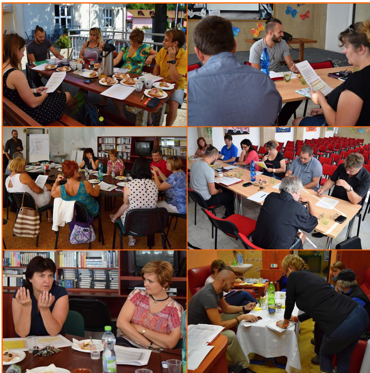
Obrázek č. 3: Jednání pracovních skupin

Strategický rámec je hierarchicky strukturovaný. Na vrcholu hierarchie stojí vize, která představuje nadčasové zhmotnění představ zapojených aktérů o budoucí podobě regionálního vzdělávání, výchovy a věcí souvisejících. Tuto vizi v období do roku 2023 naplňují stanovené priority a cíle. K formulaci každého cíle jsou pro lepší představu připojeny indikativní příklady opatření a aktivit, jejichž prostřednictvím je lze naplnit. Principiálně jsou však vítány jakékoli další zde nezmiňované aktivity, které k dosažení stanovených cílů přispívají. Problematickým momentem formulace priorit a cílů je však skutečnost, že strategický rámec je zdrojově a organizačně ukotven ve vzduchoprázdnu (viz níže).