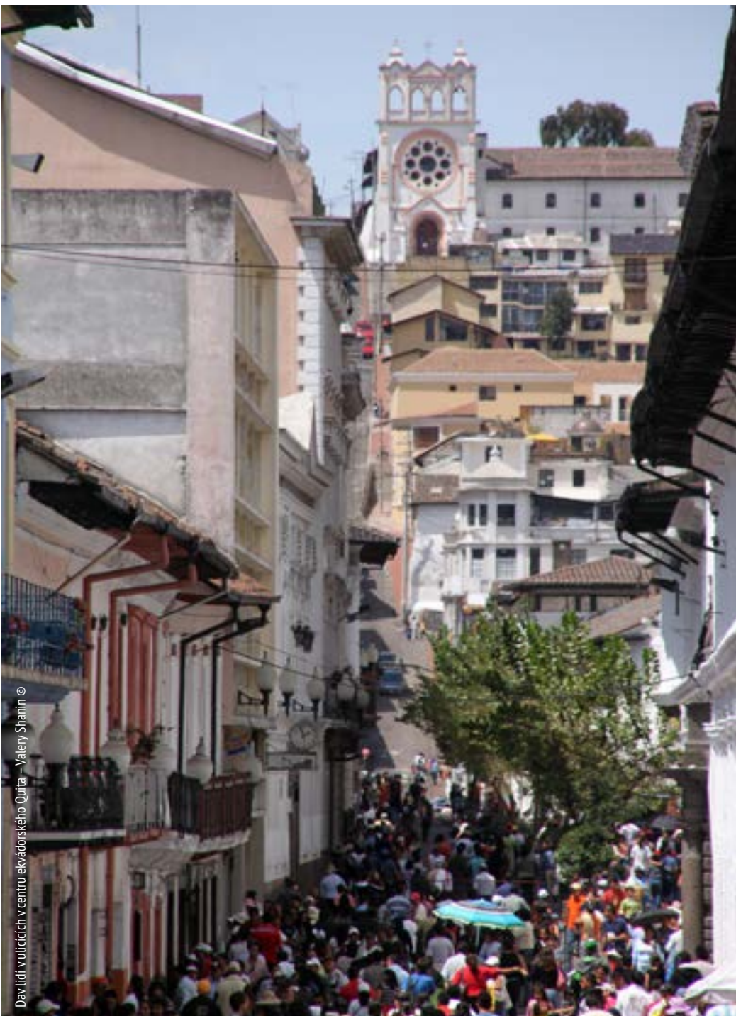
Dav lidí v uličkách v centru ekvádorského Quita

a dalších podpůrným službám, stejně jako jejich možnost projevit názor a zastoupení. Postupného přechodu pracovníků a ekonomických subjektů do sféry formální ekonomiky bude dosaženo uplatněním vyváženého přístupu, který bude kombinovat pobídky a opatření zaměřená na dodržování platných předpisů a požadavků a současně podporovat zachování a zlepšení stávajících možností obživy. Při přechodu na formální ekonomiky budeme brát v úvahu konkrétní podmínky, právní předpisy, politiky, praxe a priority jednotlivých zemí.