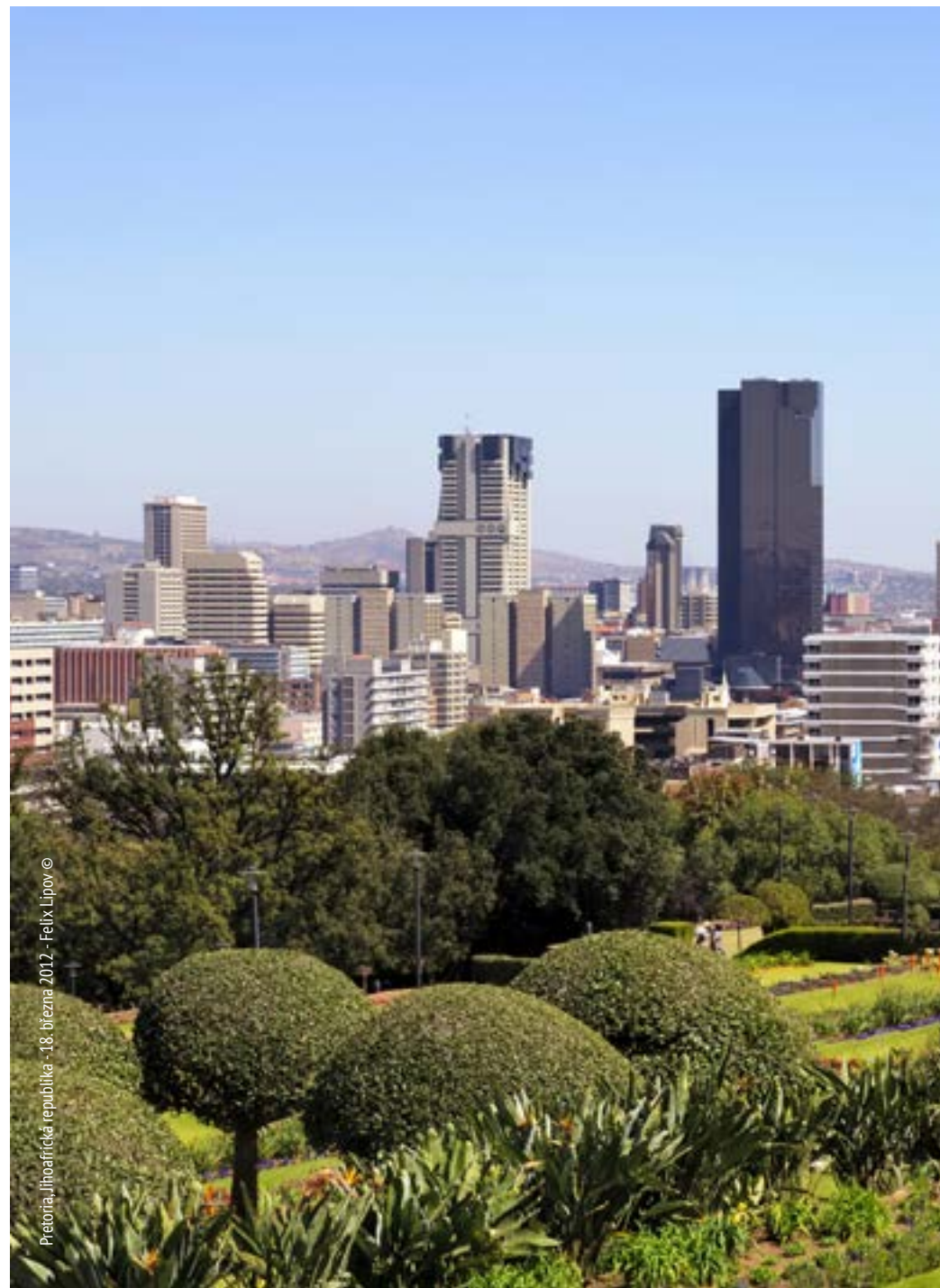
Pretoria, Jihoafrická republika - 18. března 2017

175. Požadujeme, aby generální tajemník ve své čtvrtletní zprávě, kterou má předložit podle bodu 166 výše v roce 2026, vypracoval přehled dosaženého pokroku a problémů, kterým čelí provádění Nové agendy pro města od jejího přijetí, a stanovil další opatření k jejich řešení.