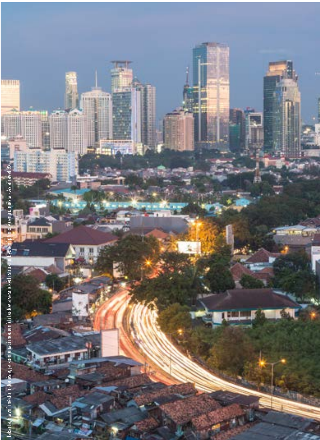
Jakarta, hlavní město Indonésie, je kombinací moderních budov a vesnických struktur bydlení přímo v centru města

29. Zavazujeme se, že posílíme koordinační úlohu orgánů národní a případně oblastní či místní veřejné správy a jejich spolupráci s dalšími veřejnými subjekty a nevládními organizacemi v oblasti poskytování sociálních a základních služeb pro všechny, včetně získávání investic v obcích, které jsou nejvíce ohroženy katastrofami a jsou postihovány opakovanými a vleklými humanitárními krizemi. Dále se zavazujeme, že budeme podporovat odpovídající služby, ubytování i příležitosti k důstojné a produktivní práci pro osoby postižené krizovými událostmi v městském prostředí a že ve spolupráci s místními komunitami a orgány místní veřejné správy budeme vyhledávat příležitosti k využití a rozvíjení místních, trvalých a důstojných řešení a že současně zajistíme pravidelnou pomoc postiženým osobám a jejich hostitelským komunitám, aby se zabránilo regresí jejich rozvoje.