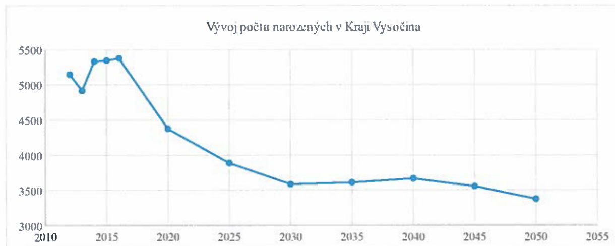
Obrázek 3: Prognóza vývoje narozených v Kraji Vysočina