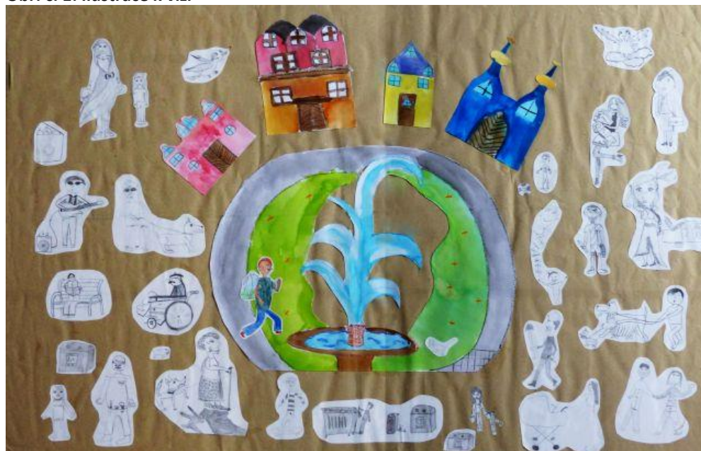
Obr. č. 1: Ilustrace k vizi

Chceme, aby Karlovarsko bylo místem příležitostí.