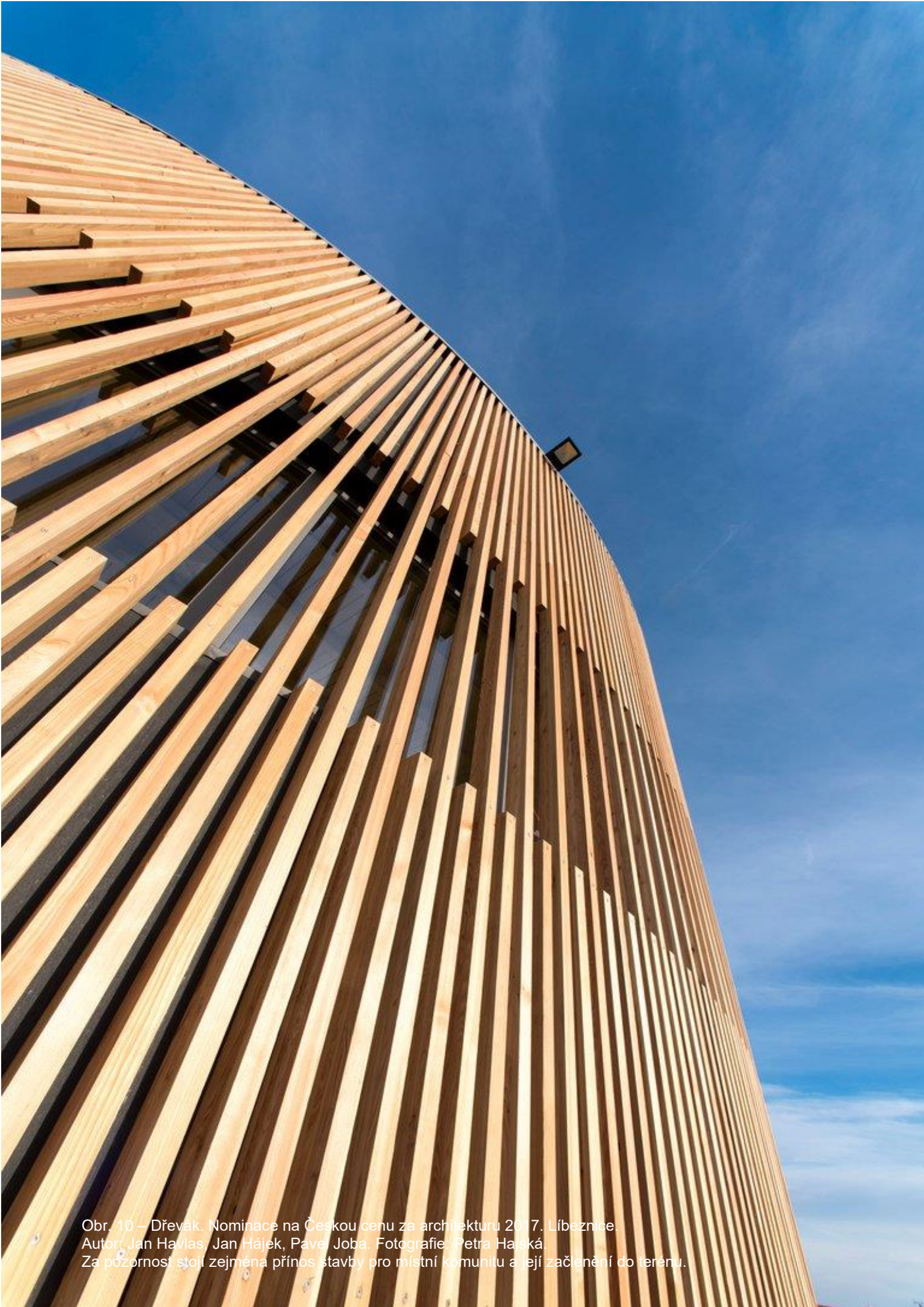
Obr. 10 – Dřevák. Nominace na Českou cenu za architekturu 2017. Líbeznice. Autor: Jan Havlas, Jan Hájek, Pavel Joba. Za pozornost stojí zejména přínos stavby pro místní komunitu a její začlenění do terénu.