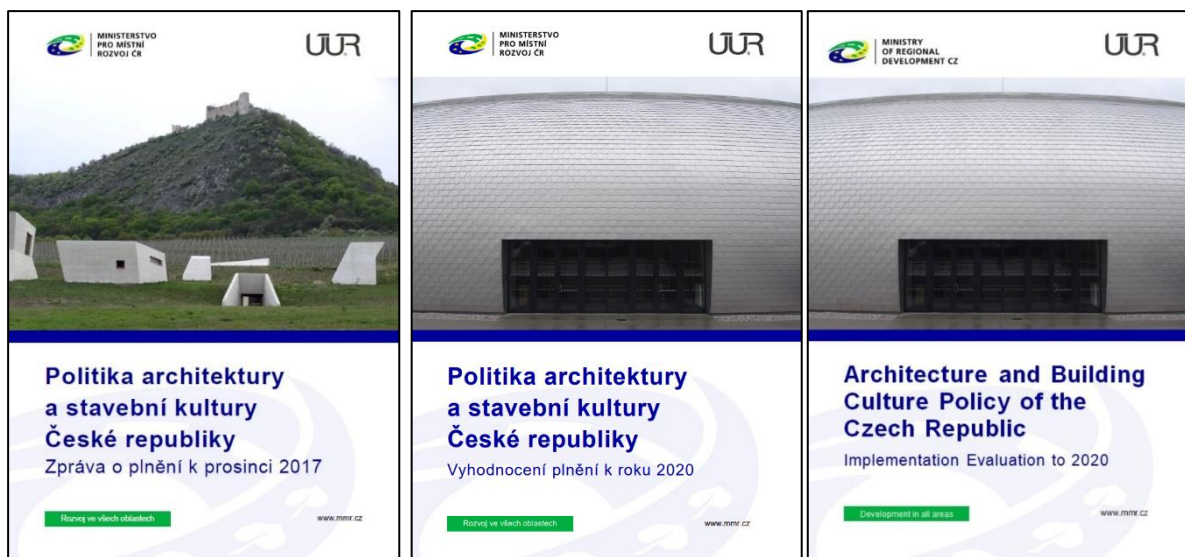
Obr. 15 – Zpráva o plnění Politiky architektury a stavební kultury České republiky k prosinci 2017