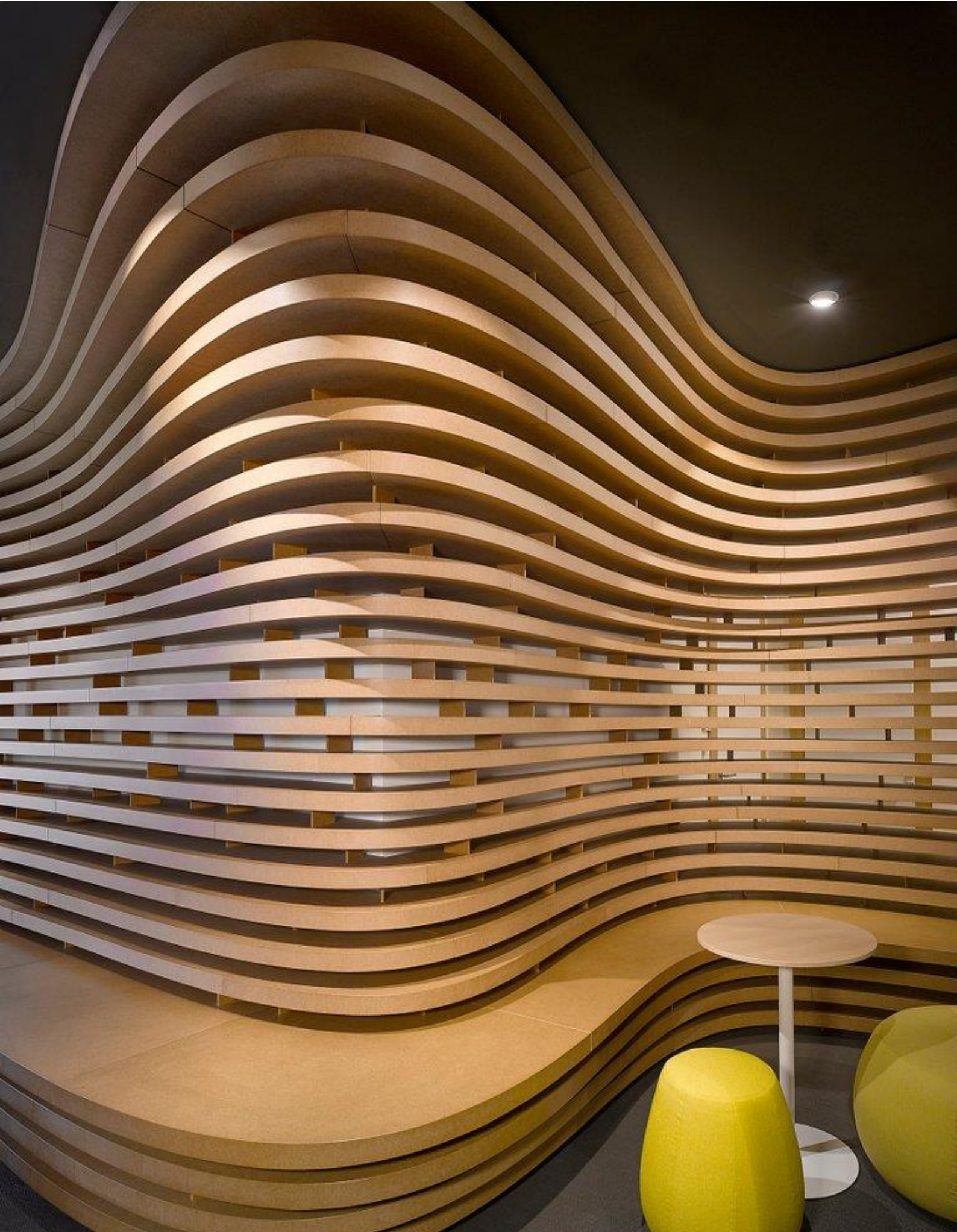
Obr. 11 – Vo2max fyzioterapie. Přihlášené dílo na Českou cenu za architekturu 2017. Praha 8. Autor: Marek Deyl, Jan Šesták. Pozornost si zaslouží zejména organické tvarování interiéru a jeho barevná kombinace.