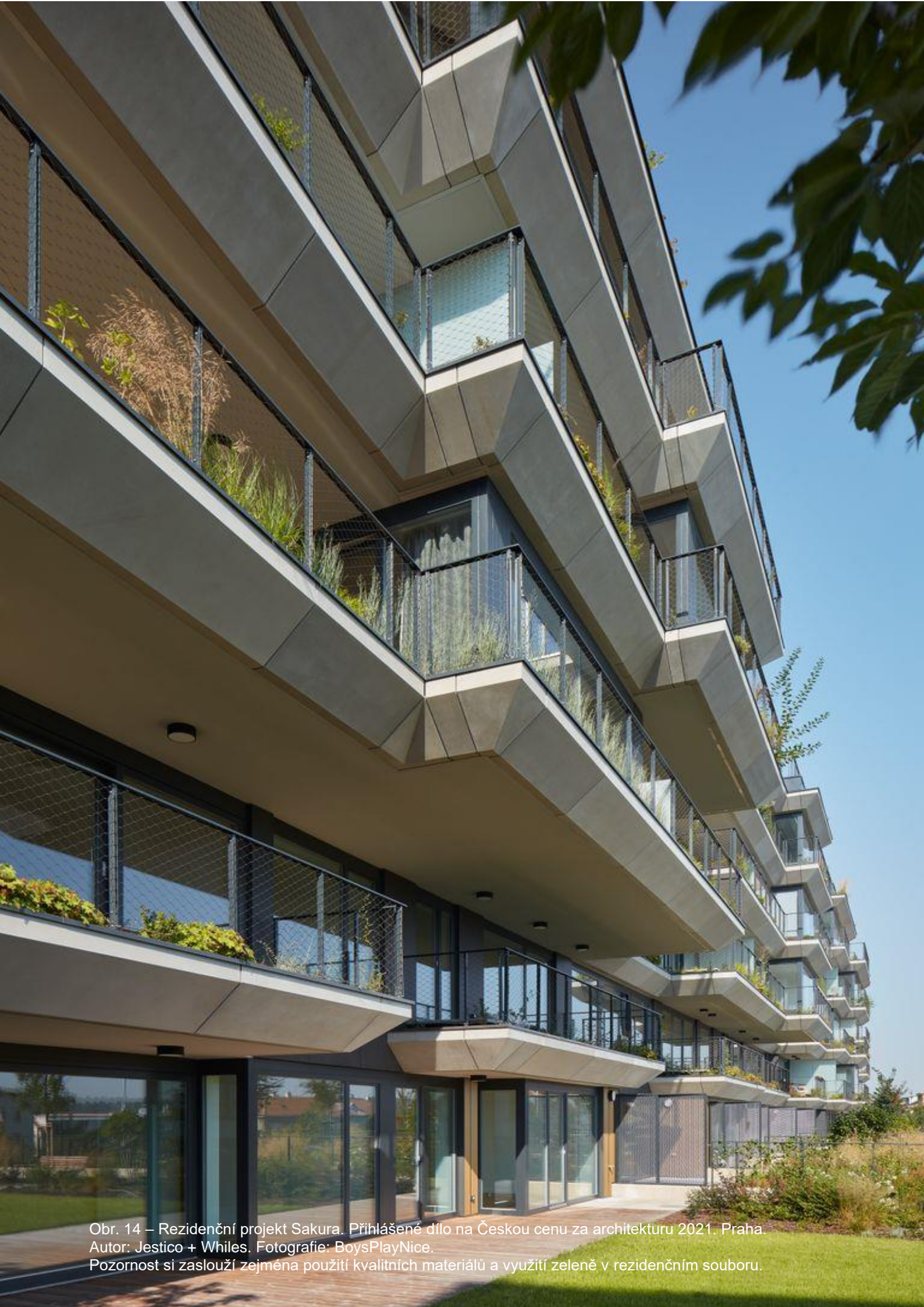
Obr. 14 – Rezidenční projekt Sakura. Přihlášené dílo na Českou cenu za architekturu 2021. Praha. Autor: Jestico + Whiles. Pozornost si zaslouží zejména použití kvalitních materiálů a využití zeleně v rezidenčním souboru.