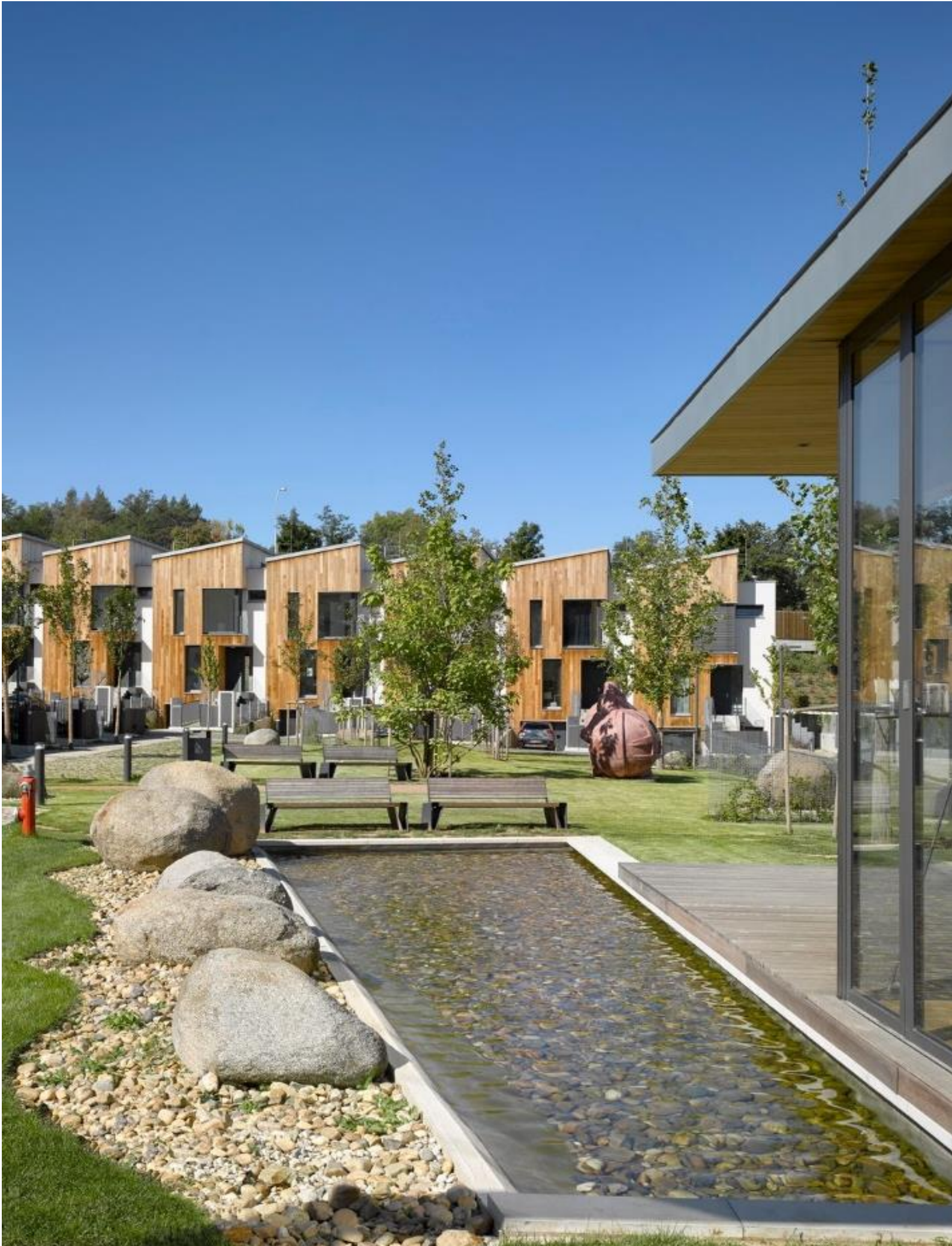
Obr. 7 – Top rezidence Šárecké údolí. Uchazeč o Českou cenu za architekturu 2020. Praha 6. Autor: Ing. arch. Oldřich Hájek, prof. Ing. arch. Jaroslav Šafer. Pozoruhodné je zejména zachování prvků původní zástavby a vytvoření společného prostoru mezi rodinnými domy.