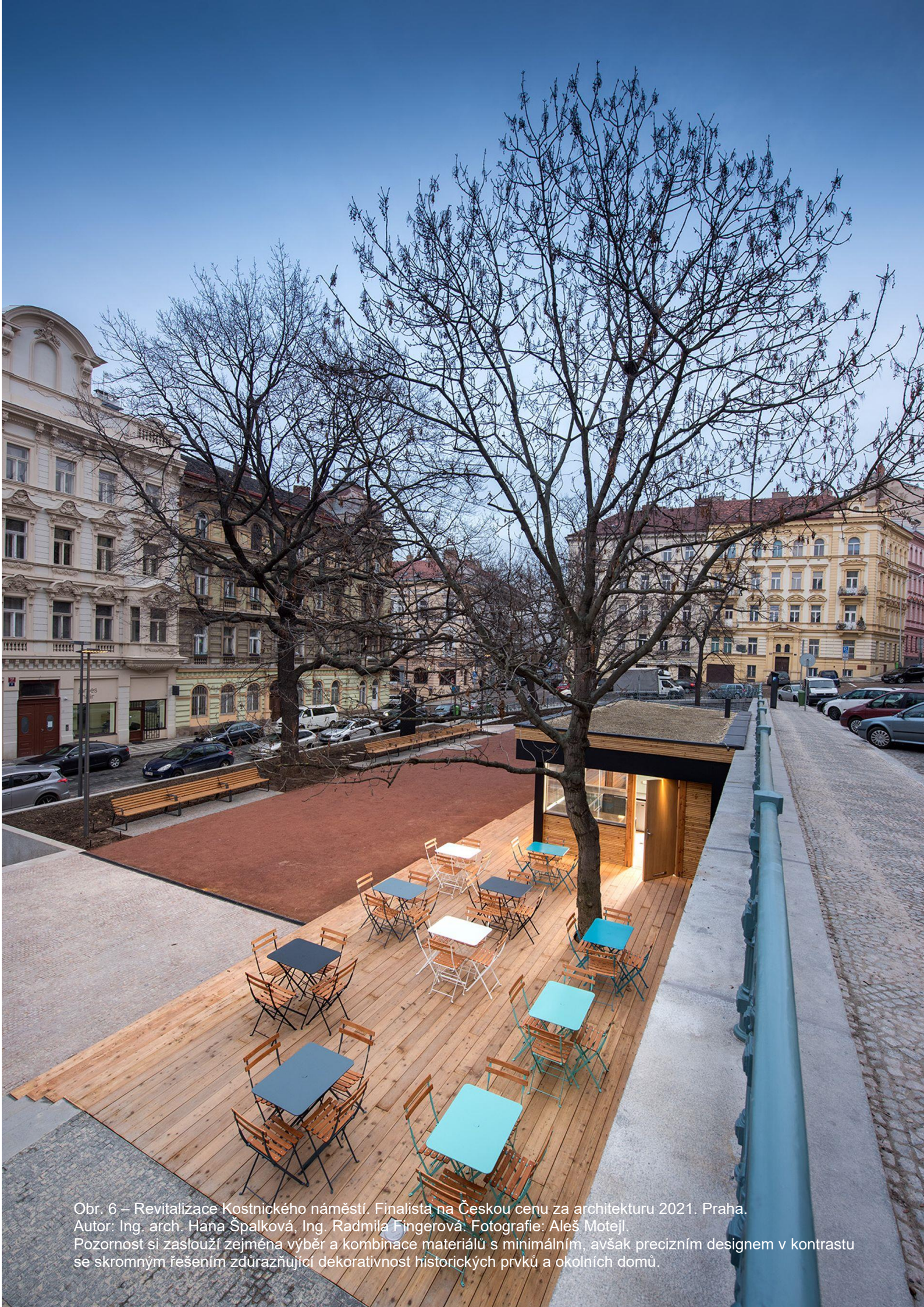
Obr. 6 – Revitalizace Kostnického náměstí. Finalista na Českou cenu za architekturu 2021. Praha. Autor: Ing. arch. Haňa Špalková, Ing. Radmila Fingerová. Fotografie: Aleš Motejl. Pozornost si zaslouží zejména výběr a kombinace materiálů s minimálním, avšak precizním designem v kontrastu se skromným řešením zdůrazňující dekorativnost historických prvků a okolních domů.