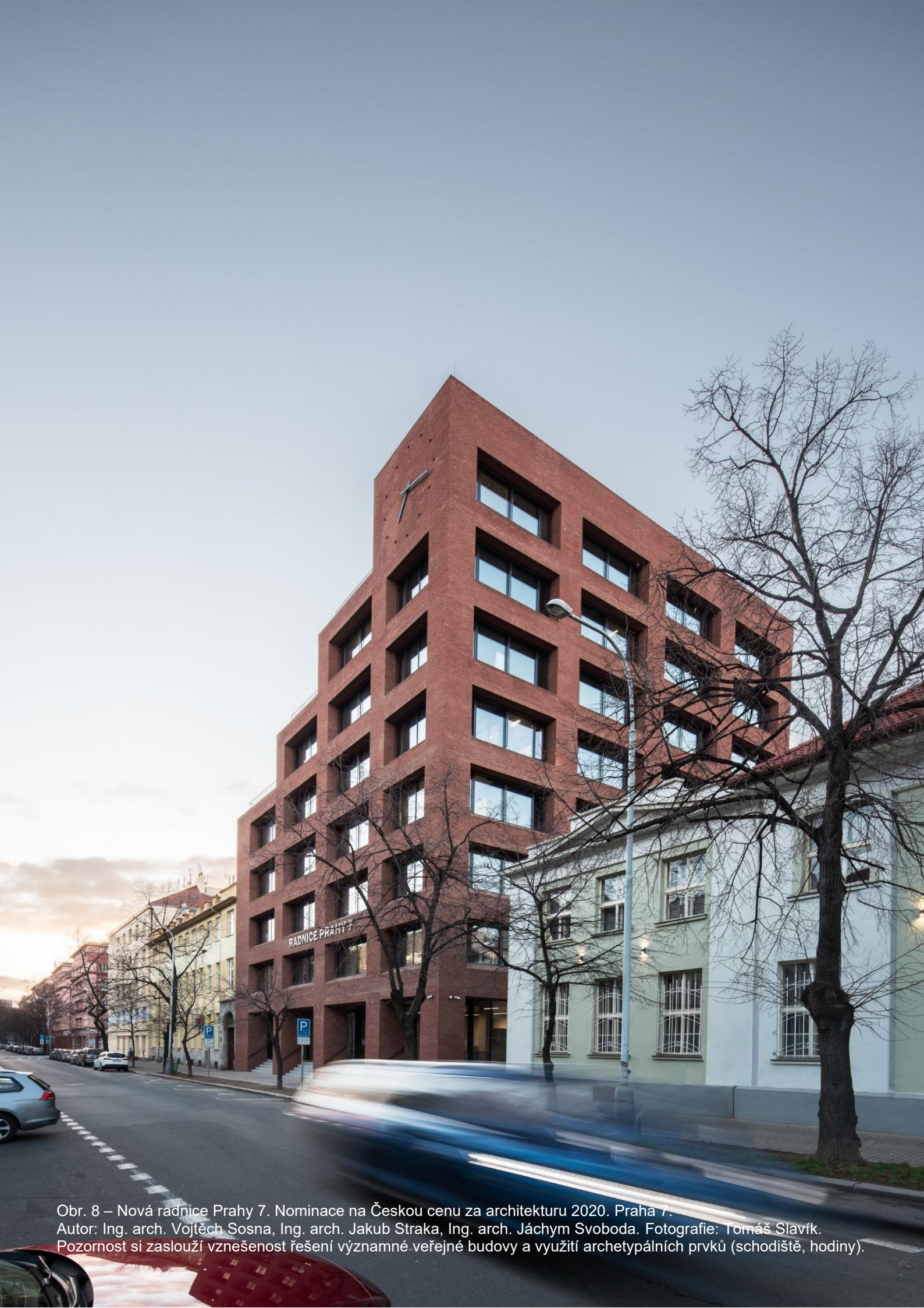
Obr. 8 – Nová radnice Prahy 7. Nominace na Českou cenu za architekturu 2020. Praha 7. Autor: Ing. arch. Vojtěch Sosna, Ing. arch. Jakub Straka, Ing. arch. Jáchym Svoboda. Pozornost si zaslouží vznešenost řešení významné veřejné budovy a využití archetypálních prvků (schodiště, hodiny).