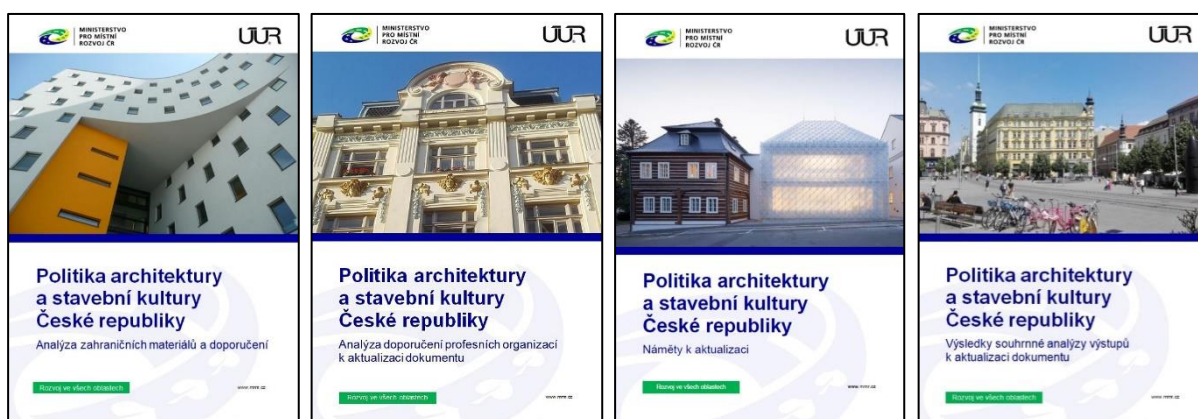
Obr. 1 – Politika architektury a stavební kultury České republiky – Analýza zahraničních materiálů a doporučení

Naplnění Politiky architektury a stavební kultury České republiky, bylo průběžně hodnoceno, přičemž komplexní hodnocení bylo provedeno k roku 2017 a k roku 2020. Z vyhodnocení plnění vyplynulo, že po šesti letech existence Politiky architektury a stavební kultury České republiky je vhodné přistoupit k její aktualizaci. V rámci aktualizace PASK ČR vzniklo několik materiálů, ze kterých samotná aktualizace PASK ČR vychází, a které obsahují řadu analýz. Podrobněji se těmto materiálům věnuje příloha Autoři a postup tvorby.