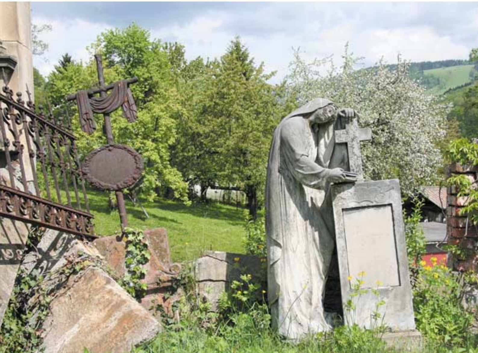
Náhrobek na veřejném hřbitově ve Vrchlabí.