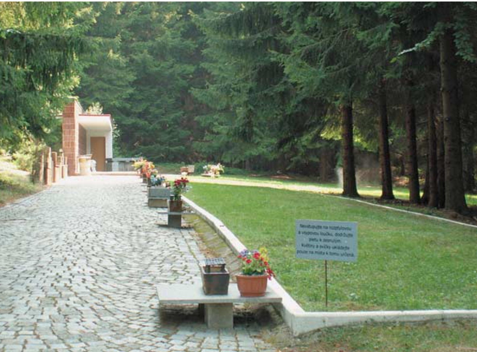
Rozptylová a vsypová loučka u krematoria v Jihlavě (Bedřichov u Jihlavy). Provozovatelem je město Jihlava, správcem Ing. Zbyšek Holeksa / Služby města Jihlavy.