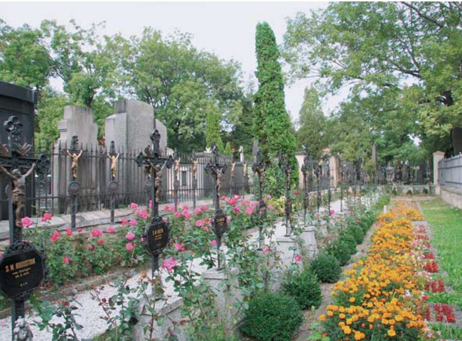
Neveřejný hřbitov konventu sester Alžbětinek (první řada) a sester Voršilek (druhá řada) na Vyšehradě v Praze.