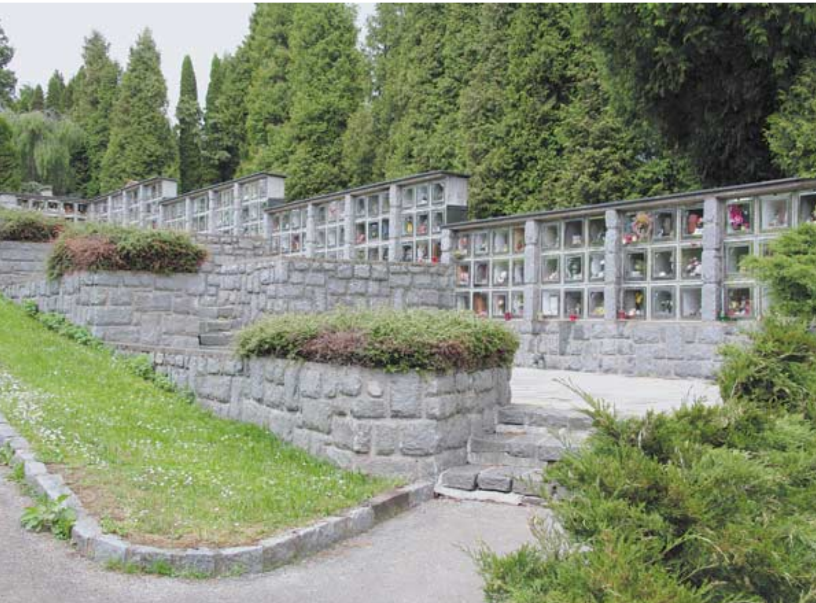
Kolumbárium na veřejném hřbitově ve Vrchlabí. Provozovatelem je město Vrchlabí, zastoupené starostou města, správcem Ing. Milan Mašek / Pohřební a hřbitovní služby.