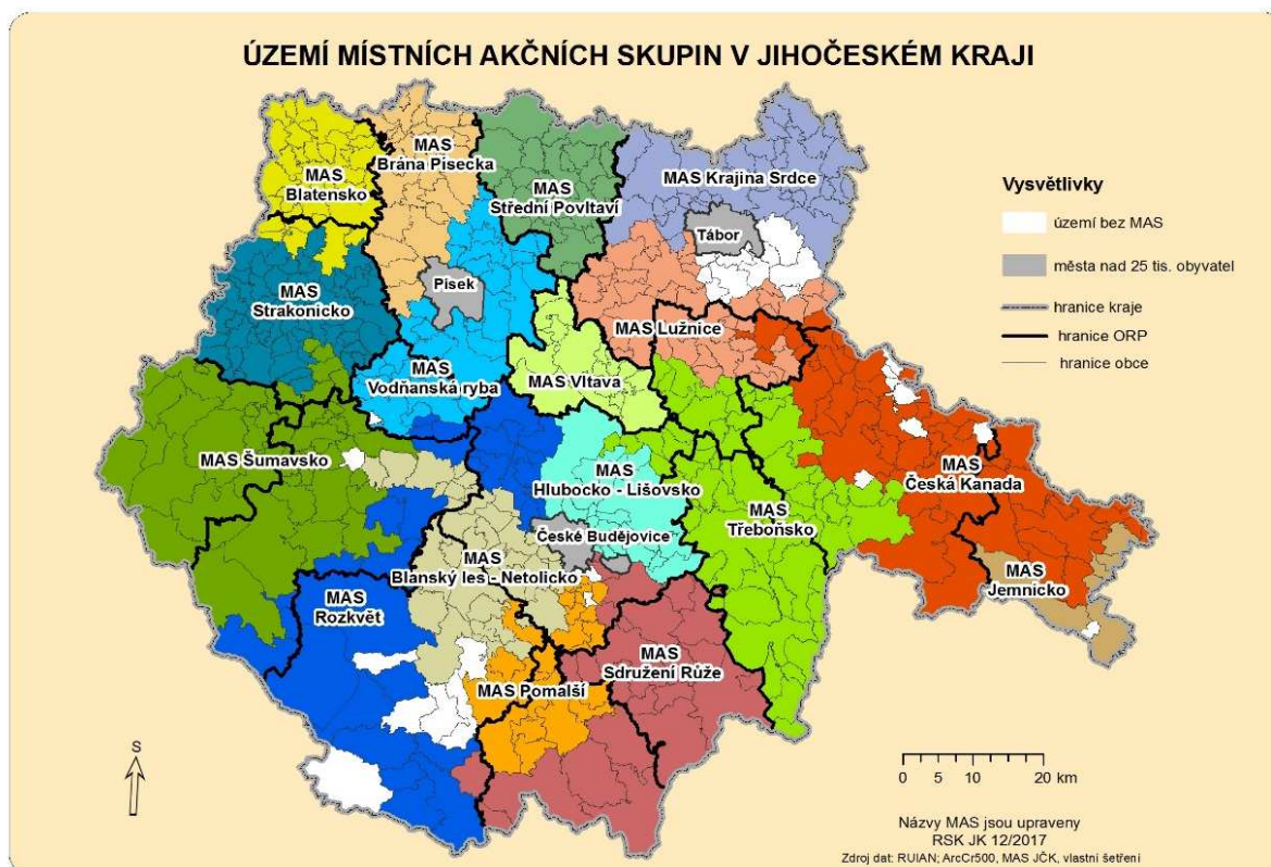
Obrázek 1: Místní akční skupiny v Jihočeském kraji (v roce 2017).

Na území Jihočeského kraje pracuje celkem 16 MAS (viz obrázek 1). Zároveň některé obce v ORP Dačice náleží do území MAS Jemnicko (z Kraje Vysočina). V první výzvě pro předkládání SCLLD bylo předloženo celkem 15 strategií, ve druhé výzvě 1 strategie. Samotná realizace CLLD by v ideálním případě měla přinést do Jihočeského kraje přibližně 1,4 mld. Kč.