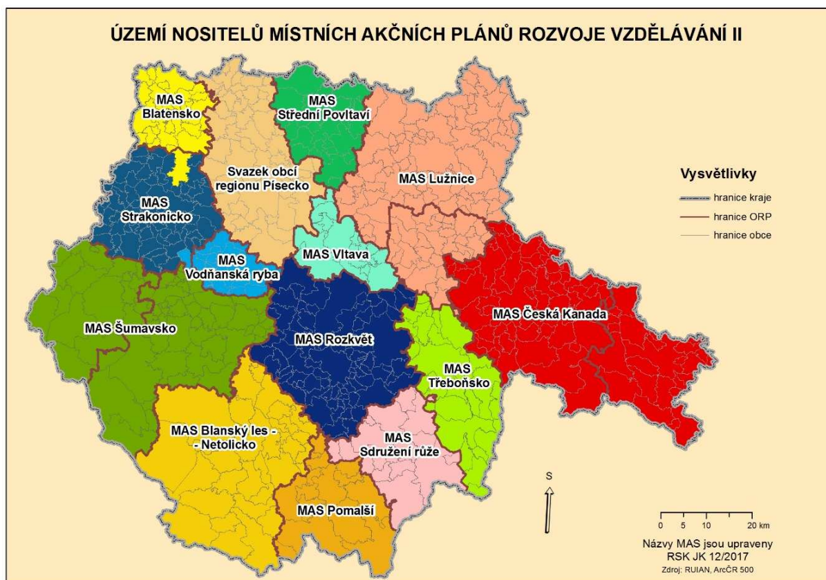
Obrázek 2: Nositelé Místních akčních plánů rozvoje vzdělávání II. v Jihočeském kraji (v roce 2017).