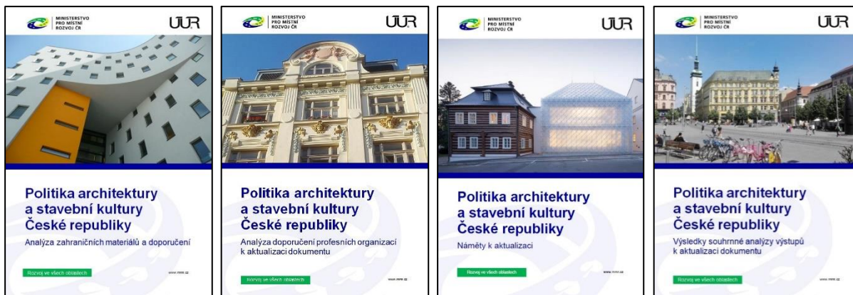
Obr. 1 – Politika architektury a stavební kultury České republiky – Analýza zahraničních materiálů a doporučení