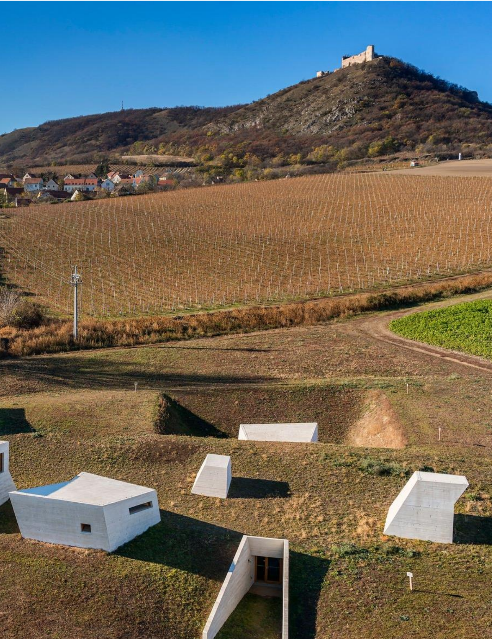
Obr. 5 – Archeopark Pavlov. Hlavní cena České ceny za architekturu 2017. Pavlov. Autor: Ing. arch. Radko Kvet, Ing. arch. Pavel Pijáček. Pozornost si zaslouží zejména začlenění díla současné architektury do krajinného rázu místa s hlubokou vazbou na přírodu, kulturní i historické dědictví a hodnotu krajiny Pálavy a jejího okolí.