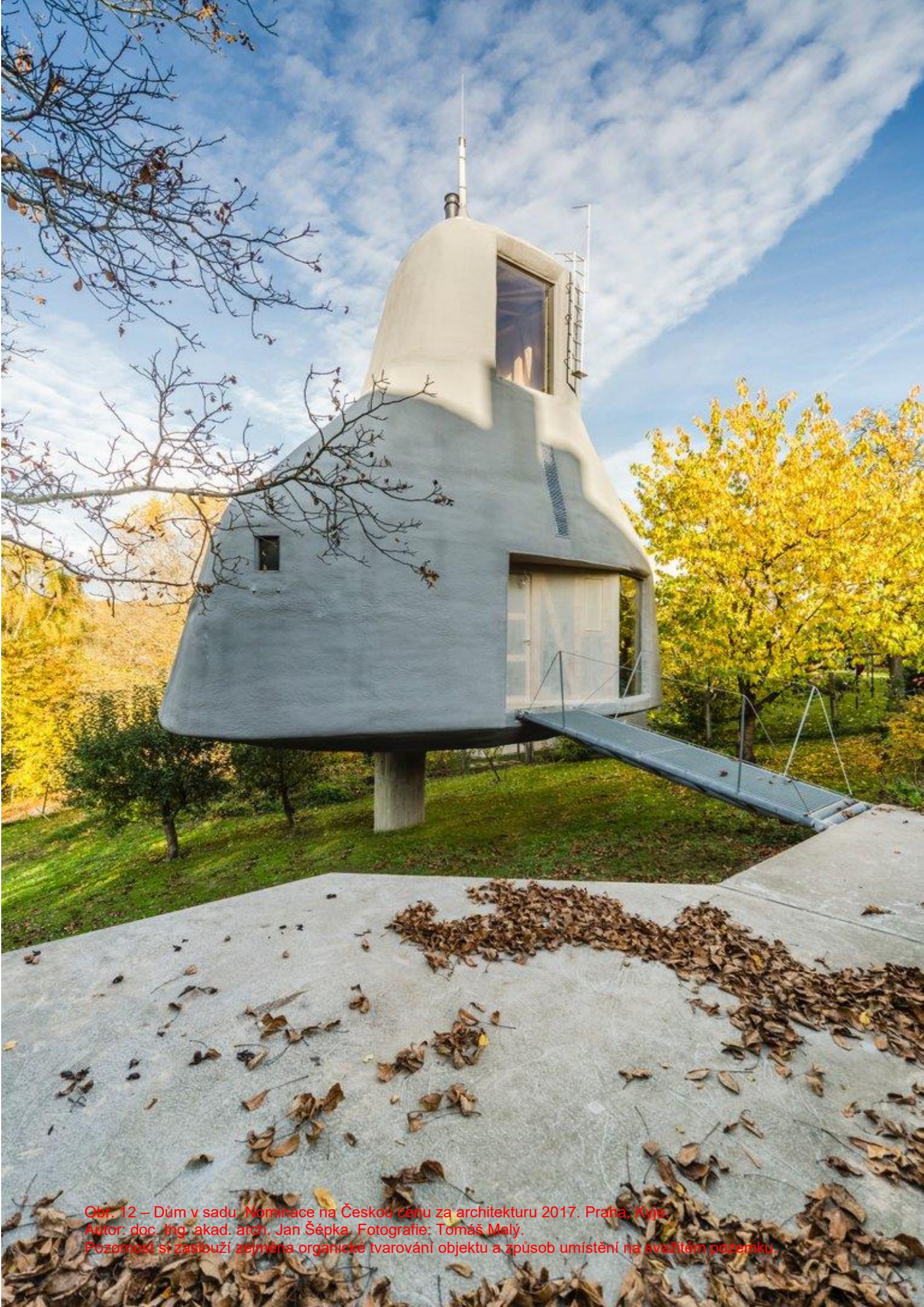
Obr. 12 – Dům v sadu, Nominace na Českou cenu za architekturu 2017. Praha, Kyje. Autor: doc. Ing. akad. arch. Jan Šépka. Pozornost si zaslouží zejména organické tvarování objektu a způsob umístění na svazitém pozemku.