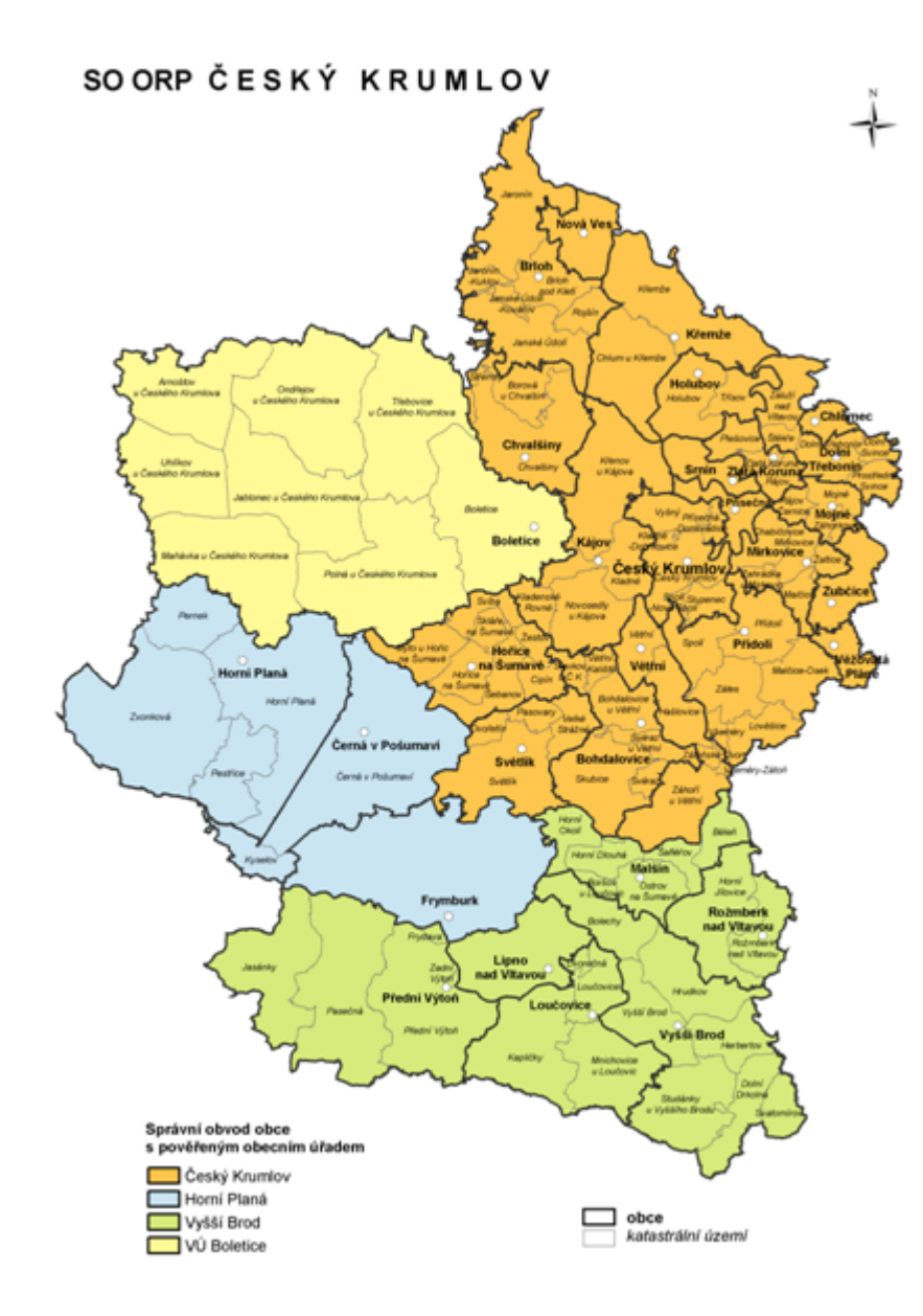
Mapa správního obvodu obce s rozšířenou působností Český Krumlov (stav k 31. 12. 2015)