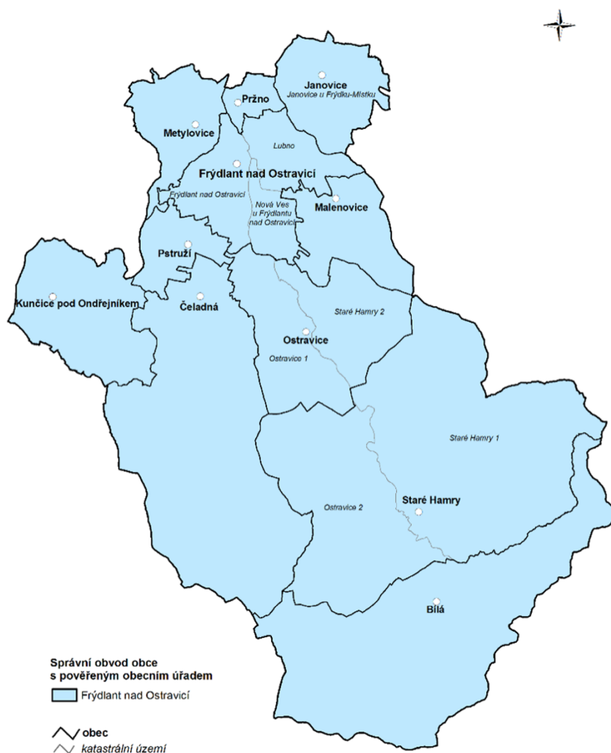
Obrázek 1 Zapojené obce