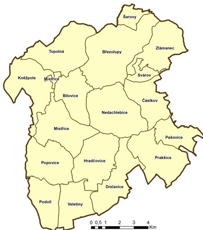
Mapa č. 1: Územní působnost MAS