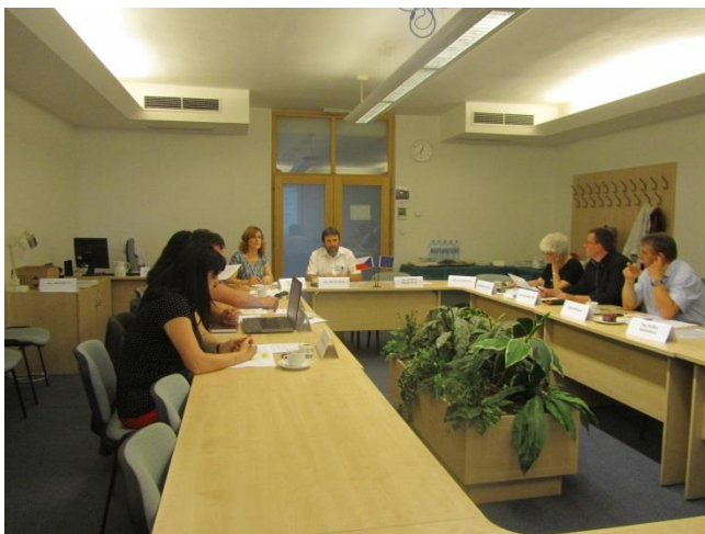
Obr. č. 5 – Zasedání PS Infrastruktura

Ze strany sekretariátu byli členové pracovní skupiny průběžně oslovováni v rámci spolupráce při mapování absorpční kapacity, identifikace bariér a bílých míst, sběru podnětů z území, které je vhodné a potřebné řešit na rovině Národní stálé konference či přímo na ŘO operačních programů a také spolupráce při přípravě Akčního plánu Strategie hospodářské restrukturalizace.