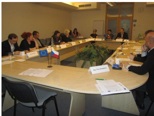
Obr. č. 4 – Zasedání PS Ekonomický rozvoj

Ze strany sekretariátu byli členové pracovní skupiny průběžně oslovováni v rámci spolupráce při mapování absorpční kapacity, identifikace bariér a bílých míst, sběru podnětů z území, které je vhodné a potřebné řešit na rovině Národní stálé konference či přímo na ŘO operačních programů.