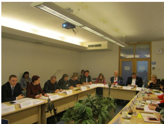
Obr. č. 1 – Zasedání RSK ÚK

svoláváno předsedou RSK ÚK prostřednictvím sekretariátu RSK ÚK tak, jak stanovuje Jednací řád Regionální stálé konference pro území Ústeckého kraje.