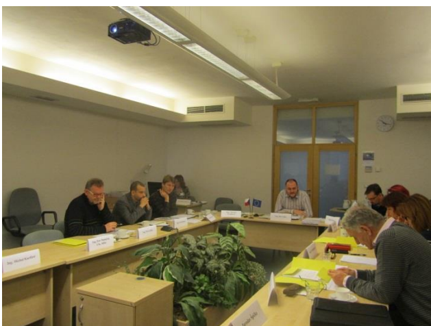
Obr. č. 6 – Zasedání PS cestovní ruch

Předmětem jednání a hlasování bylo např.: