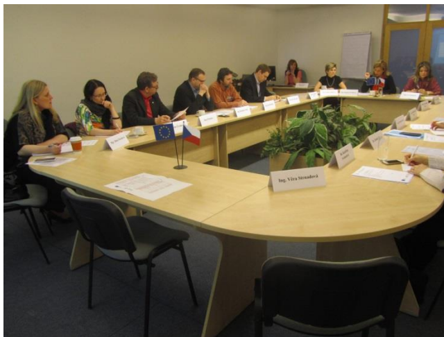
Obr. č. 3 – Zasedání PS Zaměstnanost

V úvodních etapách se PS Z seznamovala s principy fungování a příležitostmi jak zlepšit problematiku regionálního trhu práce. Velké úsilí věnovala zejména vytváření regionálních kooperujících sítí v daném území, sbírání podkladů k řešení a předávání informací. V navazujících časových etapách přenášela podněty z území k jednání a navrhovala formou konkrétních usnesení