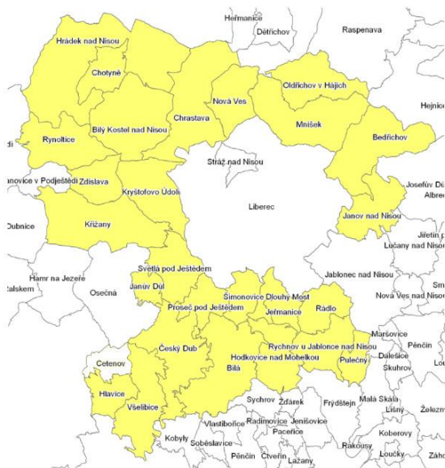
Obrázek 2 Územní působnost MAS Podještědí