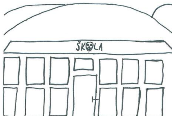
Tab. č. 3: Priority