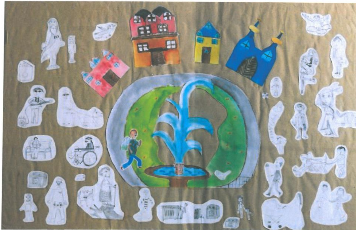
Obr. č. 1: Ilustrace k vizi