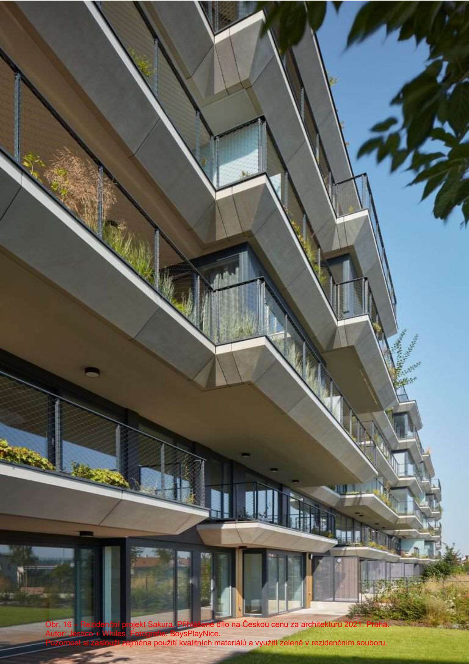
Obr. 16 – Rezidenční projekt Sakura. Přihlášeno dle na Českou cenu za architekturu 2021. Praha. Autor: Jestico + Whiles. Pozornost si zaslouží zejména použití kvalitních materiálů a využití zeleně v rezidenčním souboru.