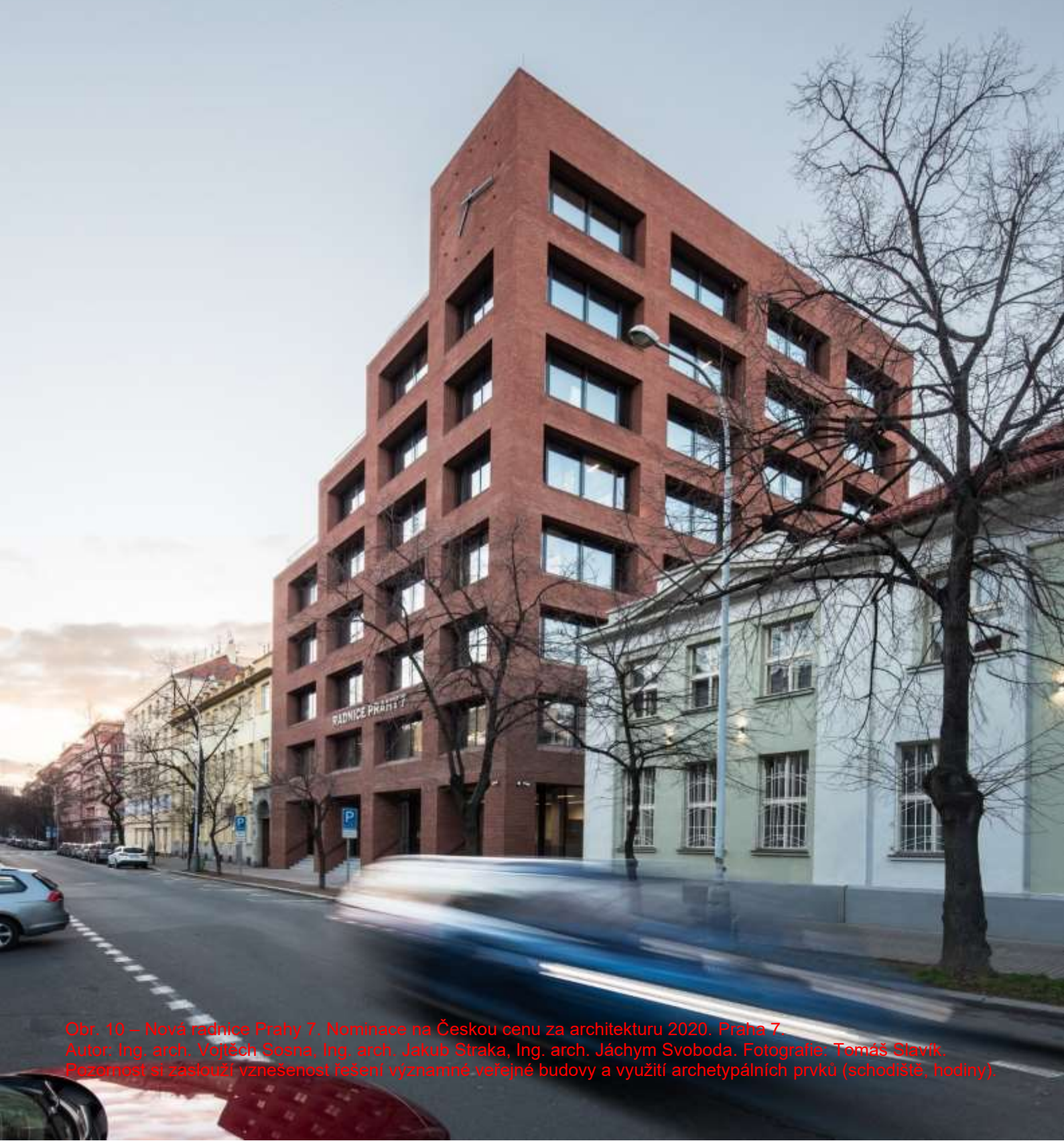
Obr. 10 – Nová radnice Prahy 7. Nominace na Českou cenu za architekturu 2020. Praha 7. Autor: Ing. arch. Vojtěch Sosna, Ing. arch. Jakub Straka, Ing. arch. Jáchym Svoboda. Pozornost si zaslouží vznešenost řešení významné veřejné budovy a využití archetypálních prvků (schodiště, hodiny).