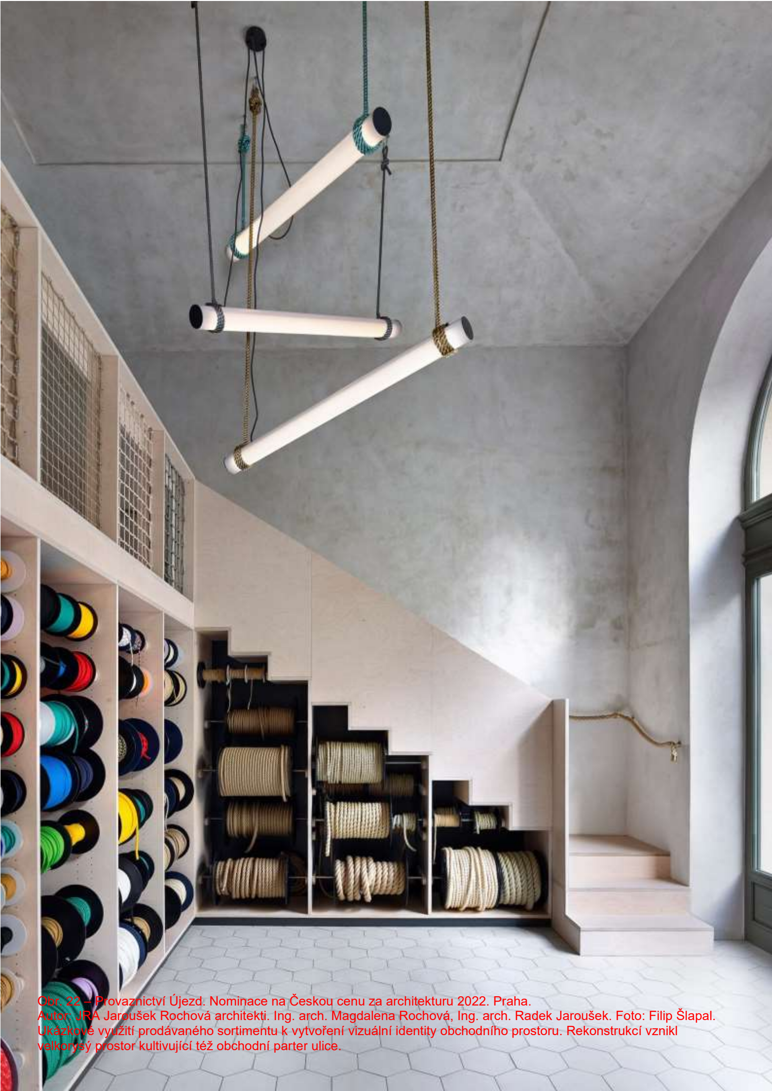
Obr. 22 – Provaznictví Újezd. Nominace na Českou cenu za architekturu 2022. Praha. Autor: JRA Jaroušek Rochová architekti. Ing. arch. Magdalena Rochová, Ing. arch. Radek Jaroušek. Ukázkové využití prodávaného sortimentu k vytvoření vizuální identity obchodního prostoru. Rekonstrukcí vznikl valkorysý prostor kultivující též obchodní parter ulice.