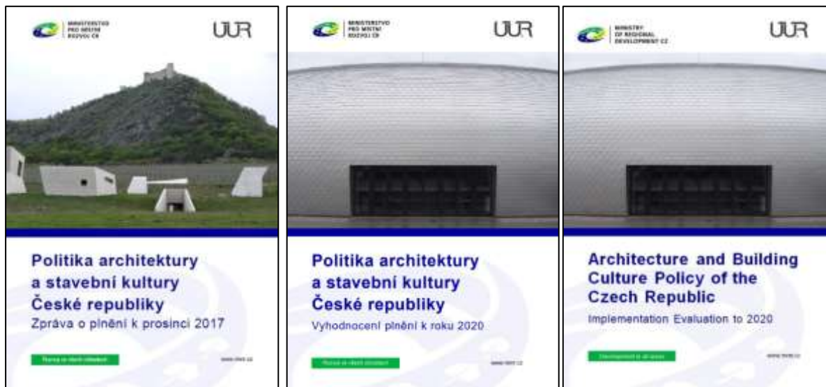
Obr. 17 – Zpráva o plnění Politiky architektury a stavební kultury České republiky k prosinci 2017

Politiky architektury a stavební kultury České republiky, z analýzy zahraničních materiálů a z doporučení profesních organizací k aktualizaci dokumentu. Cílem tohoto materiálu bylo nastínit směry, kterými by se aktualizace témat, cílů i opatření mohla ubírat.