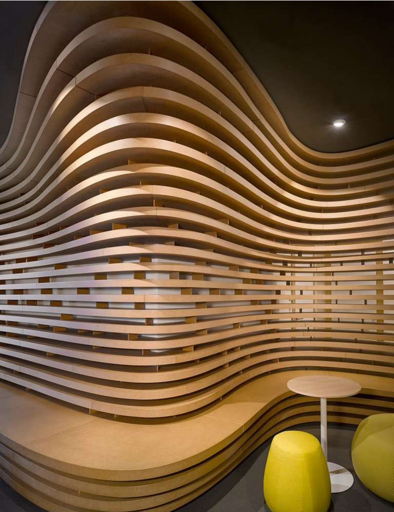
Obr. 13 – Vo2max fyzioterapie. Přihlášené dílo na Českou cenu za architekturu 2017. Praha 8 Autor: Marek Deyl, Jan Šesták. Pozornost si zaslouží zejména organické tvarování interiéru a jeho barevná kombinace.