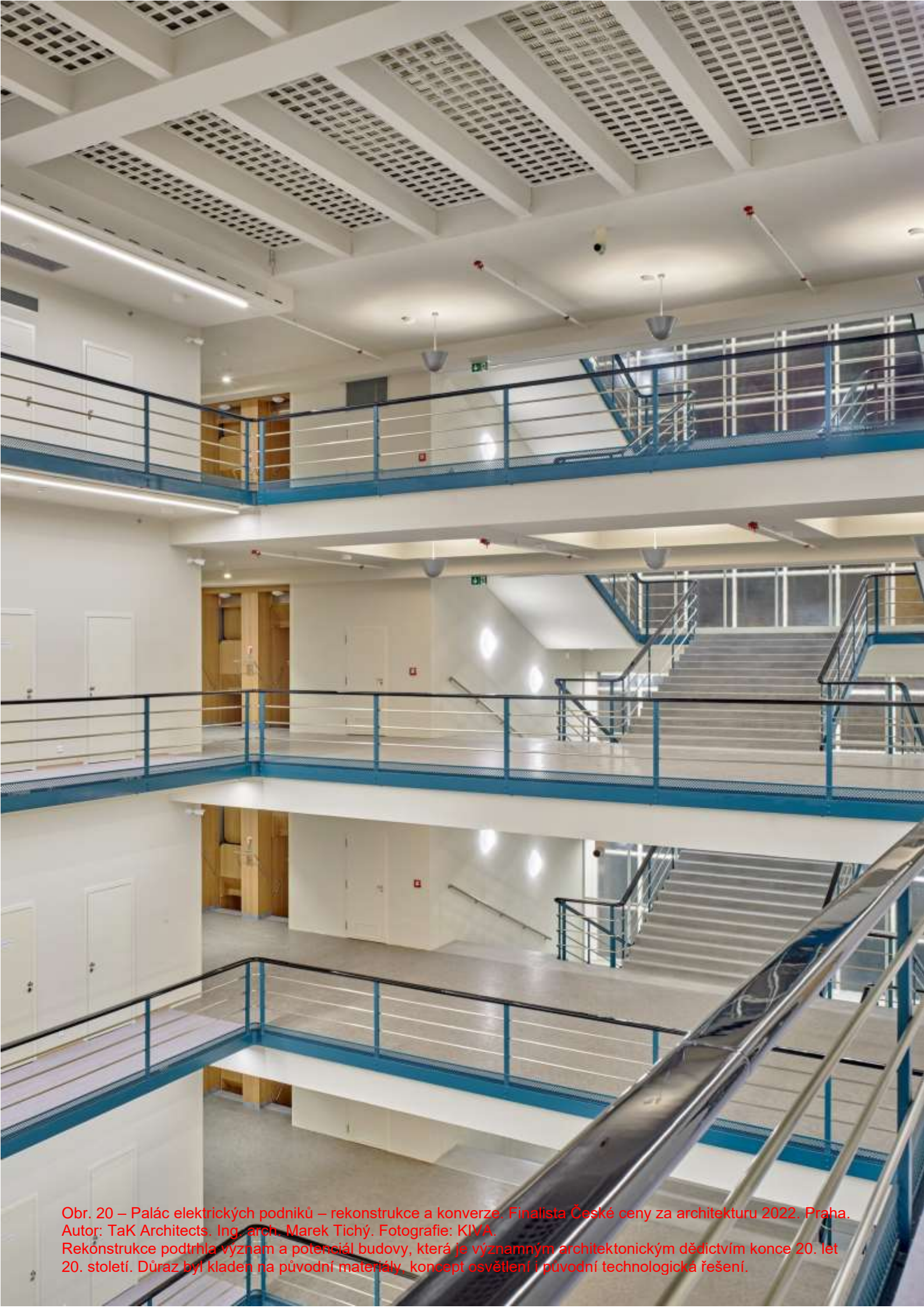
Obr. 20 – Palác elektrických podniků – rekonstrukce a konverze. Finalista České ceny za architekturu 2022. Praha. Autor: TaK Architects. Ing. arch. Marek Tichý. Rekonstrukce podtrhla význam a potenciál budovy, která je významným architektonickým dědictvím konce 20. let 20. století. Důraz byl kladen na původní materiály, koncept osvětlení i původní technologická řešení.