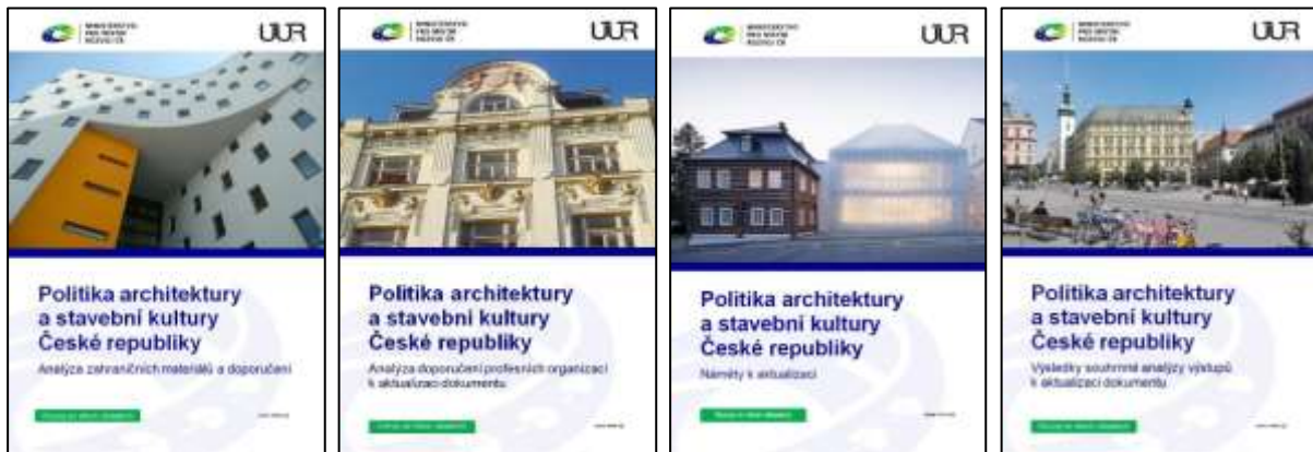
Obr. 2 – Politika architektury a stavební kultury České republiky – Analýza zahraničních materiálů a doporučení

PASK ČR vychází, a které obsahují řadu analýz. Podrobněji se těmto materiálům věnuje příloha Autoři a postup tvorby.