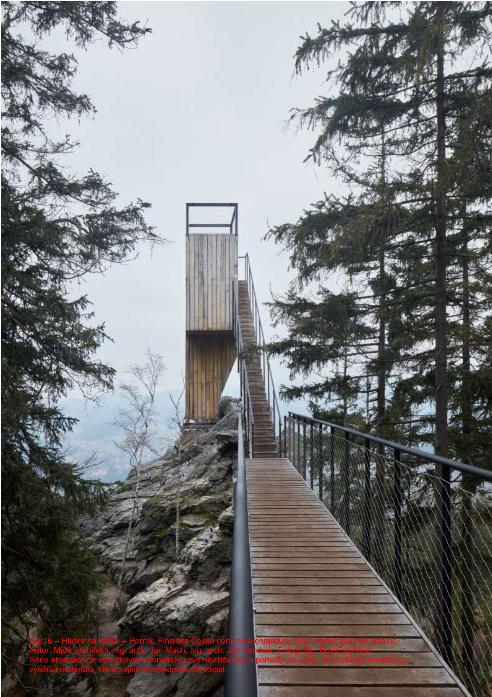
Obr. 6 – Hlídka na Stráži – Horník. Finalista České ceny za architekturu 2022. Rokytnice nad Jizerou. Autor: Mjòlk architekti, Ing. arch. Jan Mach, Ing. arch. Jan Vondrák. Série abstraktních vyhlídkových konstrukcí zve návštěvníky k pohledu do údolí. Promyšlená konstrukce využívá materiálů, které zajistí dlouhodobou životnost.