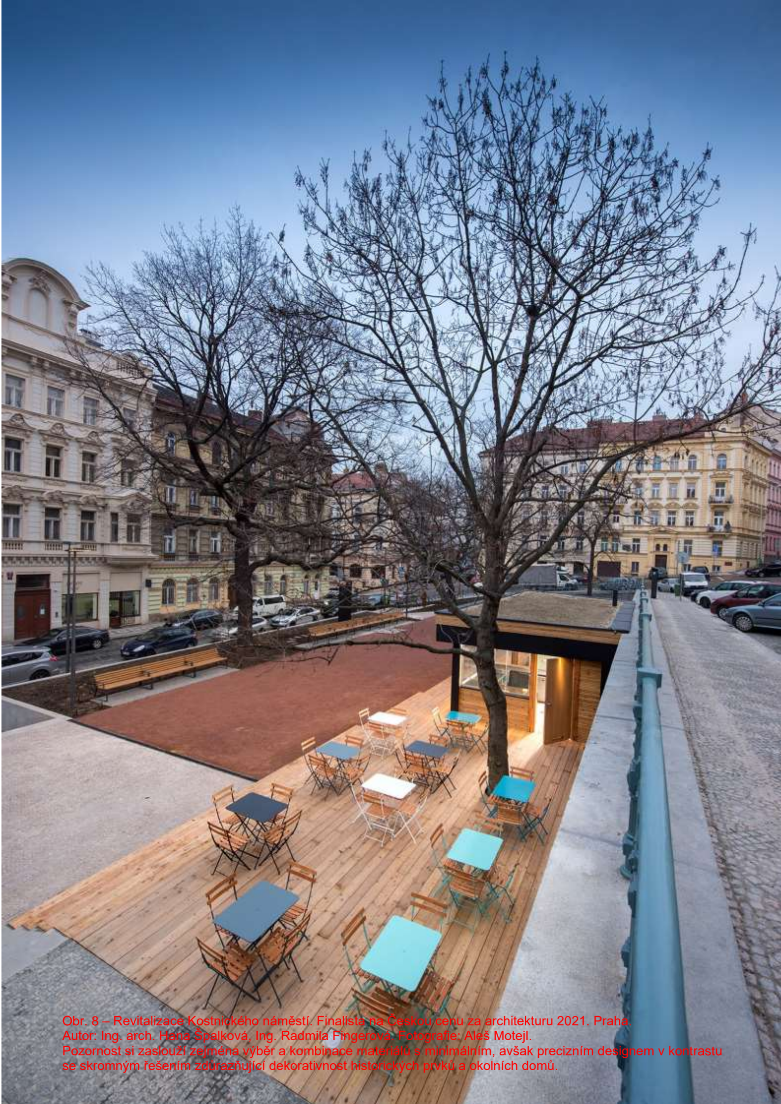
Obr. 8 – Revitalizace Kostnického náměstí. Finalista na Českou cenu za architekturu 2021. Praha. Autor: Ing. arch. Hana Špalková, Ing. Radmila Fingerová. Pozornost si zaslouží zejména výběr a kombinace materiálů s minimálním, avšak precizním designem v kontrastu se skromným řešením zdůrazňující dekorativnost historických prvků a okolních domů.