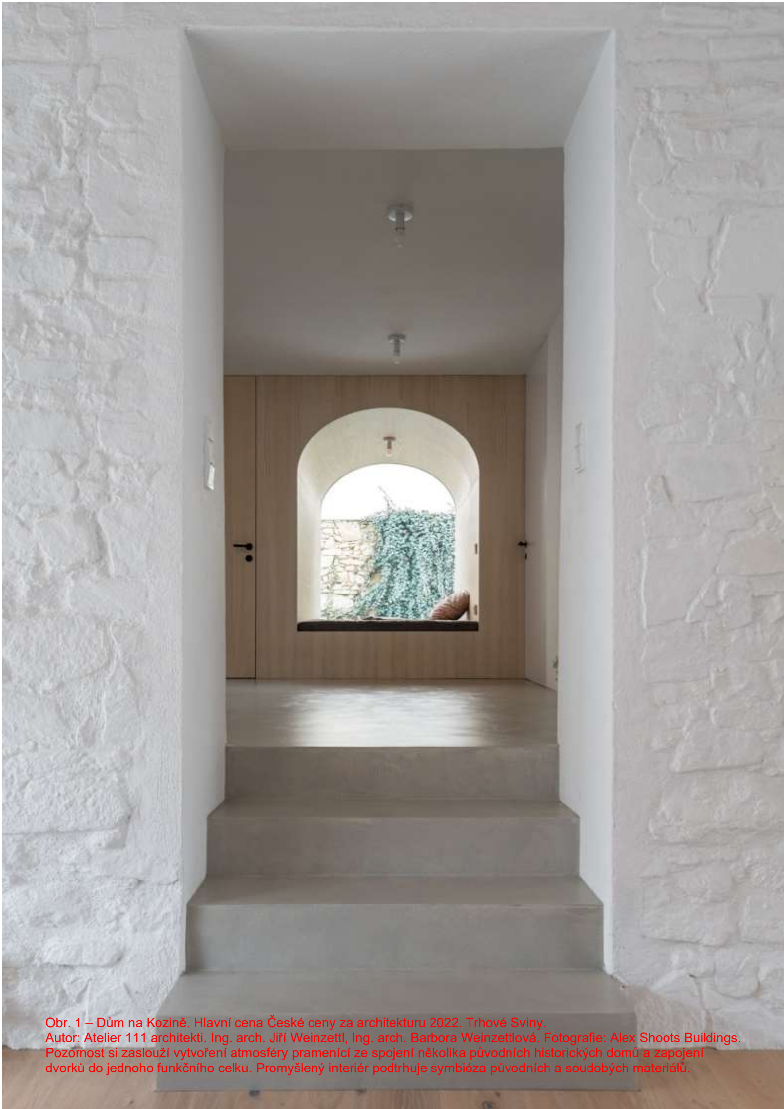
Obr. 1 – Dům na Kozině. Hlavní cena České ceny za architekturu 2022. Trhové Sviny. Autor: Atelier 111 architekti. Ing. arch. Jiří Weinzettl, Ing. arch. Barbora Weinzettlová. Pozornost si zaslouží vytvoření atmosféry pramenící ze spojení několika původních historických domů a zapojení dvorků do jednoho funkčního celku. Promyšlený interiér podtrhuje symbióza původních a soudobých materiálů.