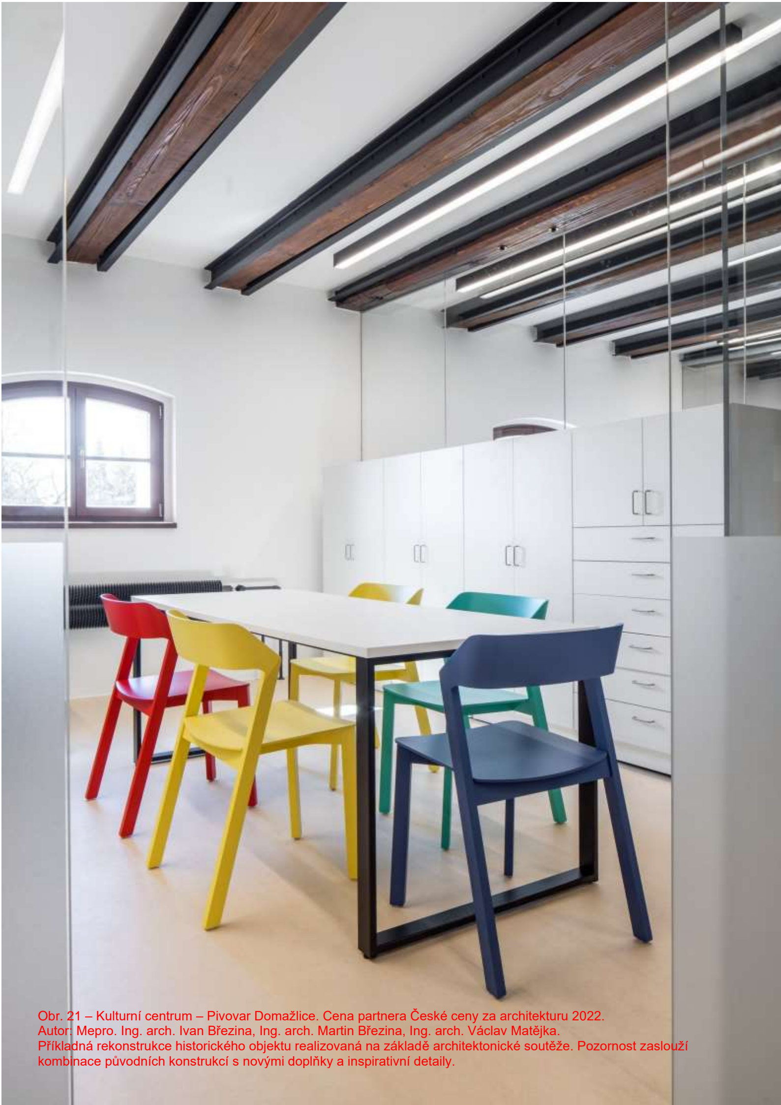
Obr. 21 – Kulturní centrum – Pivovar Domažlice. Cena partnera České ceny za architekturu 2022. Autor: Mepro. Ing. arch. Ivan Březina, Ing. arch. Martin Březina, Ing. arch. Václav Matějka. Příkladná rekonstrukce historického objektu realizovaná na základě architektonické soutěže. Pozornost zasluží kombinace původních konstrukcí s novými doplňky a inspirativní detaily.