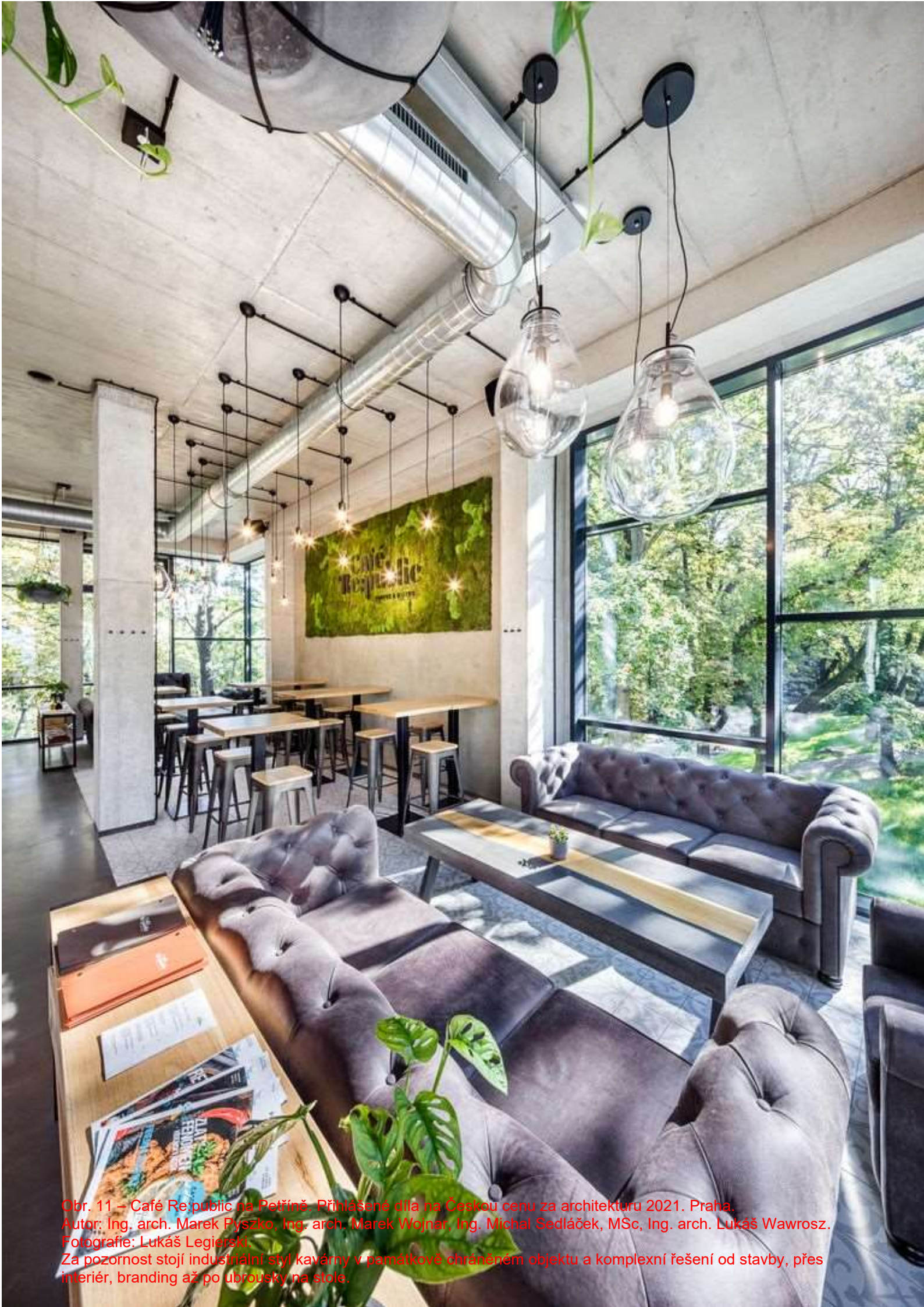
Obr. 11 – Café Re:public na Petříně. Přihlášené dílo na Českou cenu za architekturu 2021. Praha. Autor: Ing. arch. Marek Pyszko, Ing. arch. Marek Wojnar, Ing. Michal Sedláček, MSc, Ing. arch. Lukáš Wawrosz. Za pozornost stojí industriální styl kavárny v památkově chráněném objektu a komplexní řešení od stavby, přes interiér, branding až po ubrusky na stole.