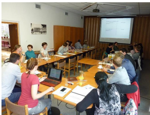
Obr. 1 Setkání aktérů působících ve vzdělávání (MěÚ Vizovice - květen 2016)