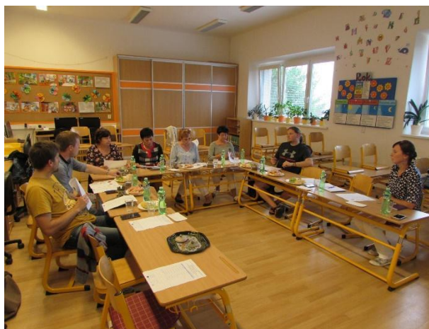
Obr. 3 Jednání pracovní skupiny ZŠ a MŠ (ZŠ a MŠ Veselá - září 2016)