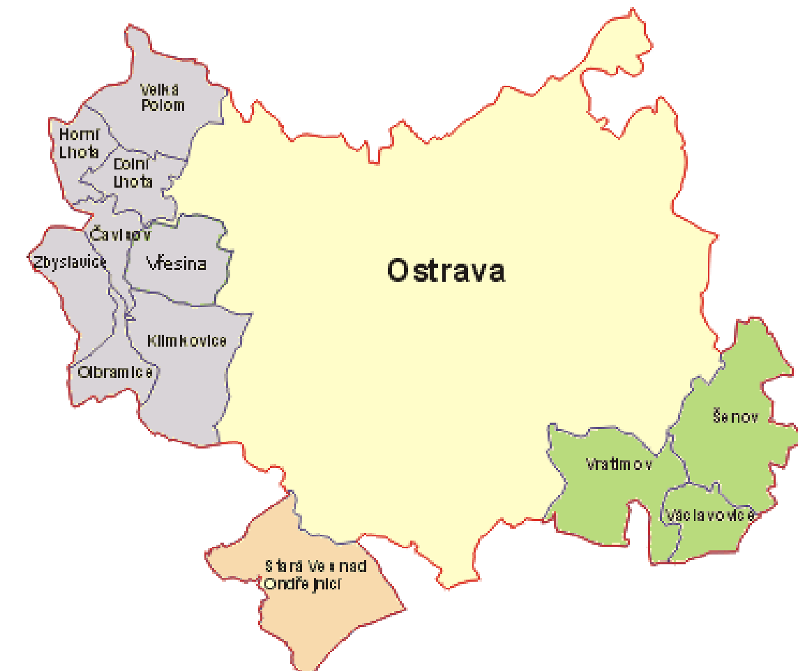
Obrázek 1 Mapa řešeného území

Uvedených 12 obcí, kromě statutárního města Ostravy, je tvořeno celkem 14 katastrálními územími. Výměra řešeného území čítá 331,51 km 2 .