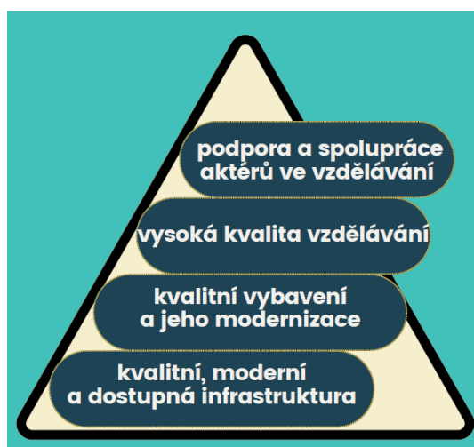
Obrázek č. 8: Schéma cílů: