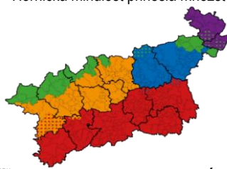
Typologie dle SRÚK