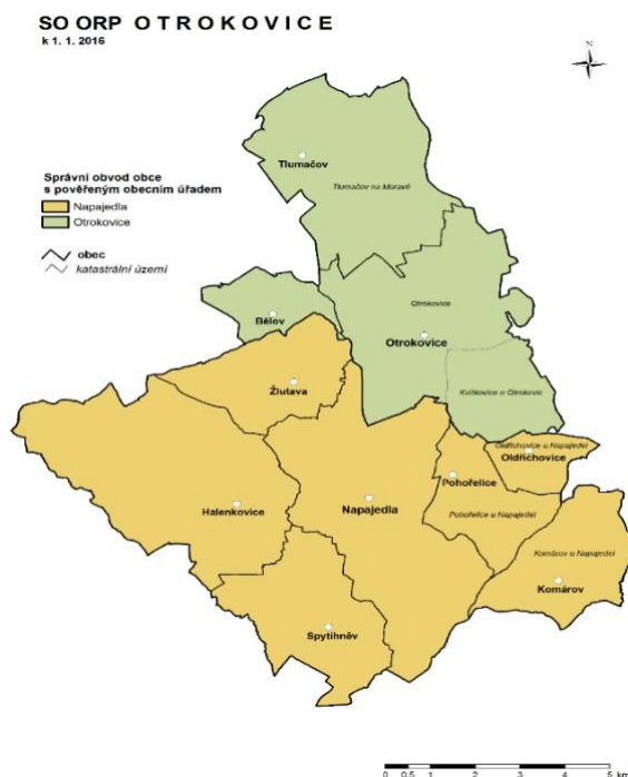
Obrázek 1 Vymezení obcí v ORP Otrokovice

Sousedy tohoto správního obvodu jsou pouze obvody Zlínského kraje. Na jihu a jihozápadě je to Uherské Hradiště, na západě kroměřížský správní obvod, na severu holešovský a na východě zlínský správní obvod.