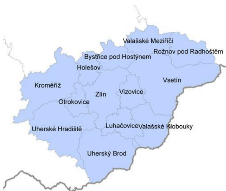
Obrázek 2 Vymezení obcí s rozšířenou působností ve Zlínském kraji

Neopomenutelnou součástí vzdělávání dětí je možnost navštěvovat ZUŠ Otrokovice a ZUŠ Rudolfa Firkušného Napajedla či Dům dětí a mládeže Sluníčko Otrokovice, Dům dětí a mládeže Matýsek v Napajedlech. Tyto organizace disponují pobočkami i v dalších obcích.