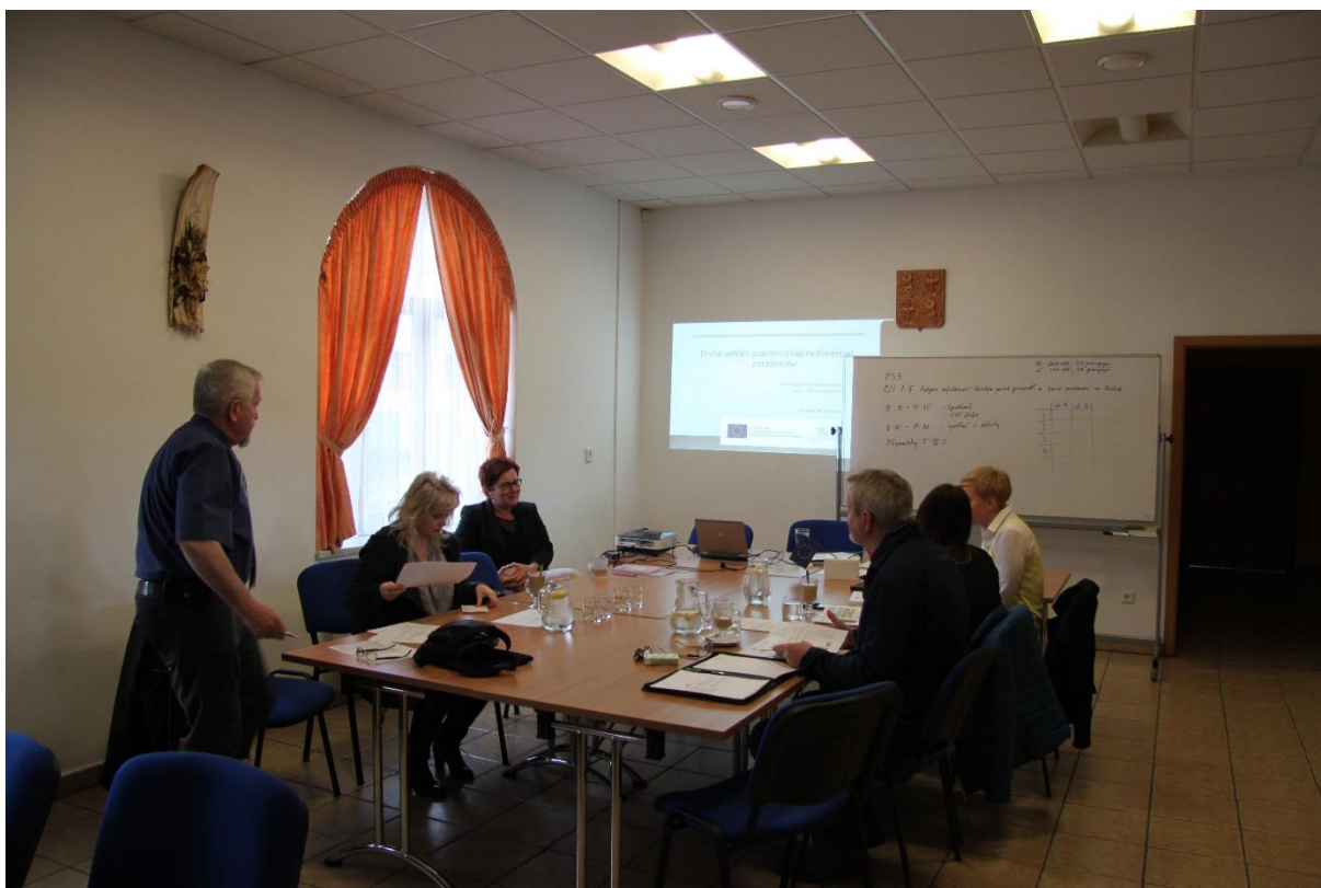
Obr. č. 13: Setkání pracovní skupiny Kariérové poradenství