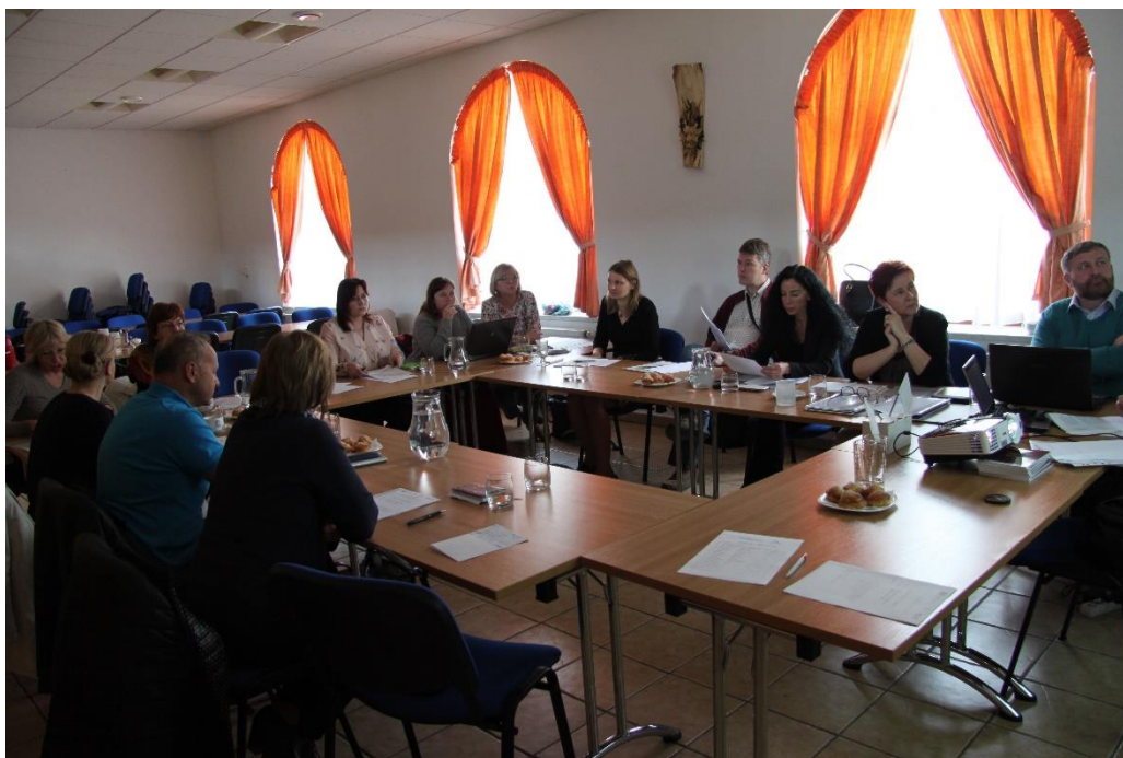
Obr. č. 7: Páté setkání Řídícího výboru MAP 29.3.2017

Dne 29.5.2017 proběhlo šesté jednání Řídícího výboru. Členové byli informováni o 1. a 2. ZoR, představen byl také seznam přistoupených členů k Memorandu o spolupráci v území a také další postup tvorby akčního plánu a aktualizace investičních záměrů. Nejdélším bodem jednání bylo projednání a odsouhlasení aktuální verze MAP dle cílů Strategického rámce MAP. Dále se Řídící výbor sešel třikrát, kde byly schváleny dílčí části dokumentu a poté i finální verze strategického dokumentu Místní akční plán rozvoje školství v SO ORP Vyškov.