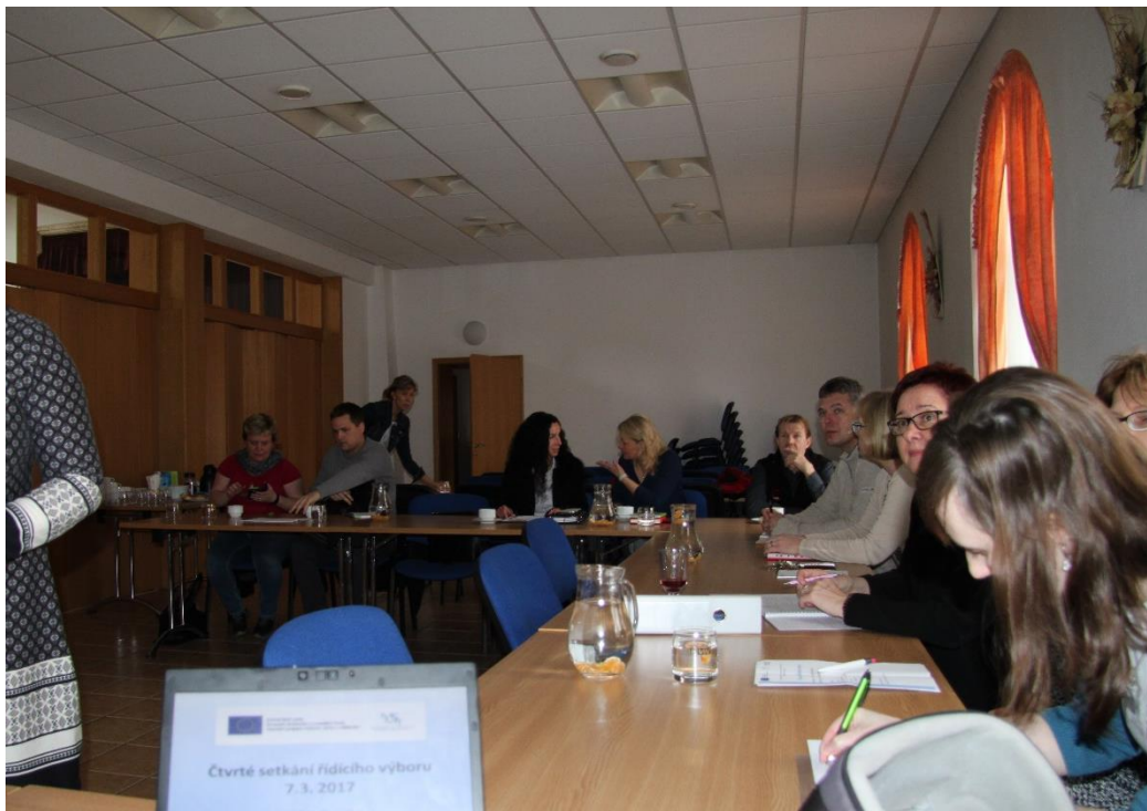
Obr. č. 6: Čtvrté setkání Řídícího výboru MAP 7.3.2017

Dne 7.3. 2017 se sešel Řídící výbor při čtvrtém setkání, kde schválil Analytickou část MAP, proběhlo hodnocení splněných úkolů a představení nového člena realizačního týmu MAP.