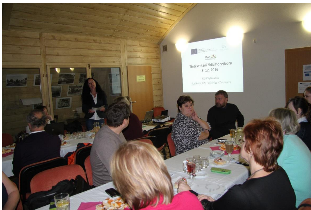
Obr. č. 5: Třetí setkání Řídícího výboru MAP 8.12.2016

Dne 8.12. 2016 proběhlo Třetí setkání Řídícího výboru. Hlavním bodem programu bylo schválení Strategického rámce včetně uvedených investičních záměrů. V dalších částech jednání členové Řídícího výboru schvalovali nové členství v Řídícím výboru a projednali úkoly pro další období.