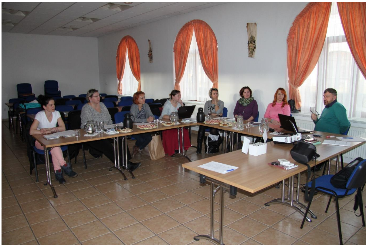
Obr. č. 9: Setkání pracovní skupiny Rozvoj podnikavosti a iniciativy dětí a žáků včetně polytechnického vzdělávání

Členové Realizačního týmu jsou se členy pracovních skupin v úzké spolupráci z důvodu připomínkování a konzultace Akčního plánu MAP.