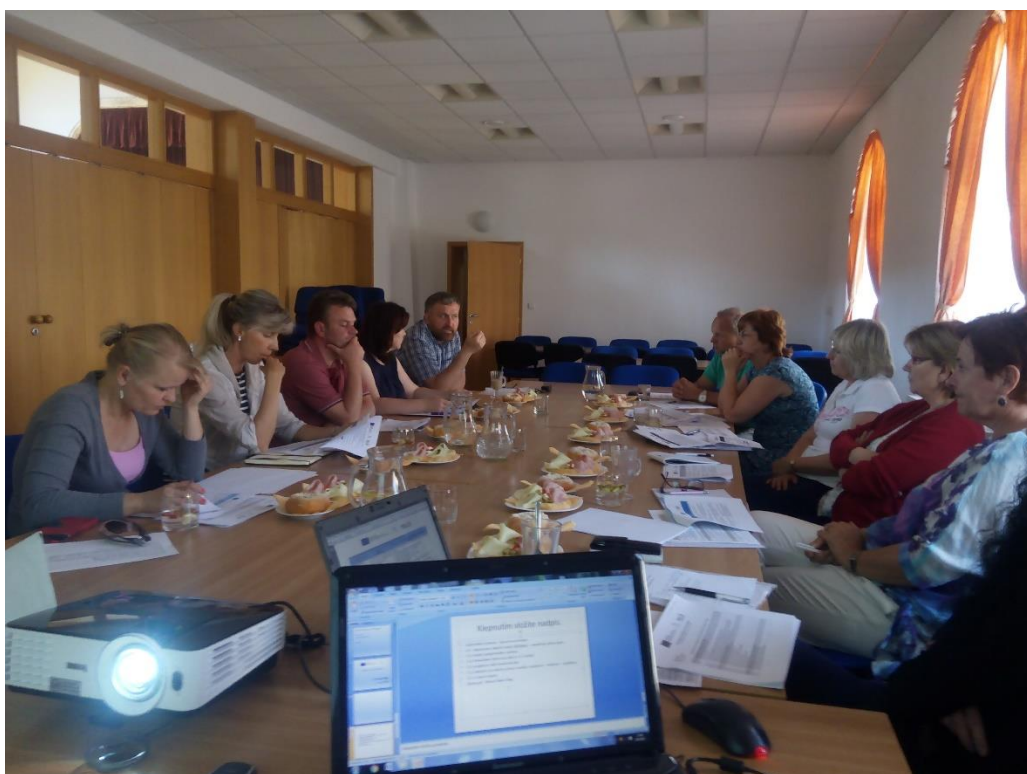
Obr. č. 8: Šesté setkání Řídícího výboru MAP 29.5.2017

Dne 29.5.2017 proběhlo šesté jednání Řídícího výboru. Členové byli informováni o 1. a 2. ZoR, představen byl také seznam přistoupených členů k Memorandu o spolupráci v území a také další postup tvorby akčního plánu a aktualizace investičních záměrů. Nejdélším bodem jednání bylo projednání a odsouhlasení aktuální verze MAP dle cílů Strategického rámce MAP. Dále se Řídící výbor sešel třikrát, kde byly schváleny dílčí části dokumentu a poté i finální verze strategického dokumentu Místní akční plán rozvoje školství v SO ORP Vyškov.