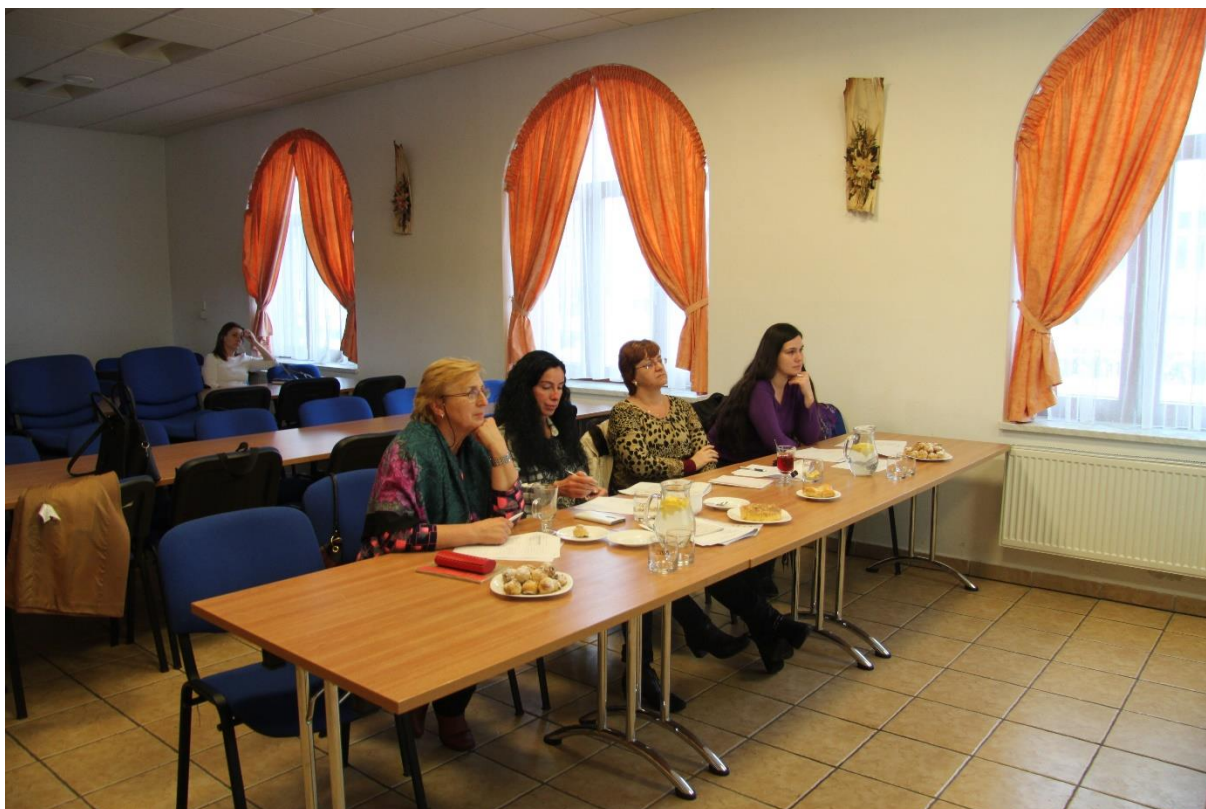
Obr. č. 10: Setkání pracovní skupiny Čtenářská gramotnost