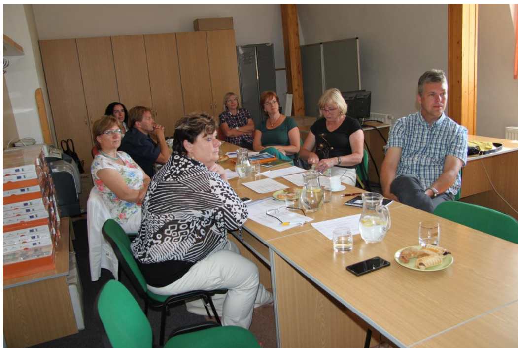
Obr. č. 3: První setkání řídicího výboru 8. 7. 2016

dotazníkového šetření. Jako poslední bylo diskutováno i obsazení pracovních skupin, přičemž byli navrženi i jejich první členové.