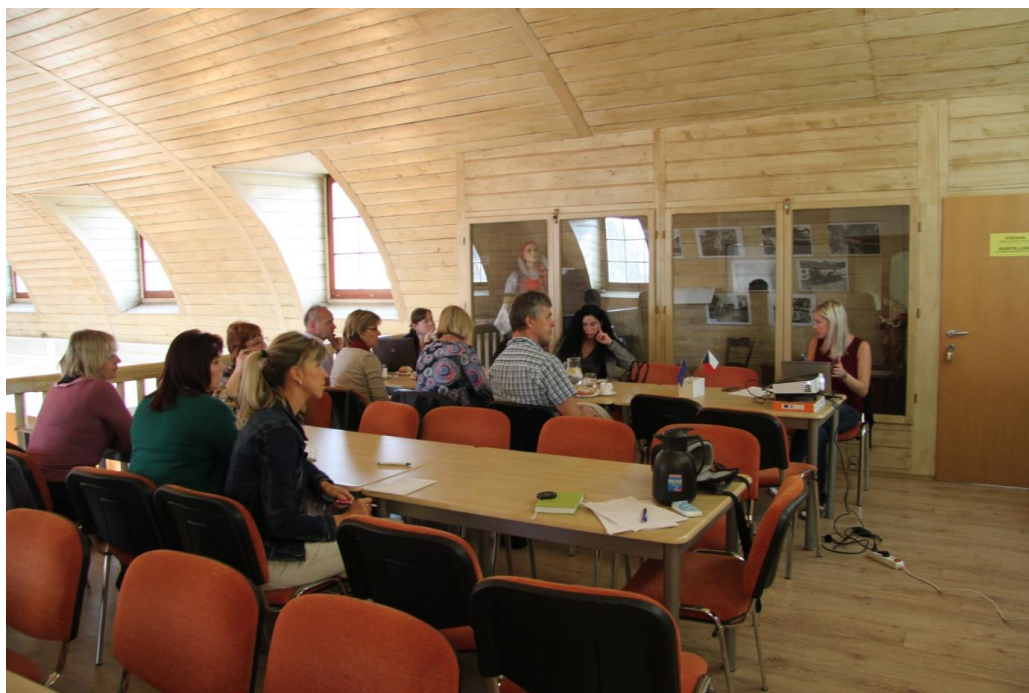
Obr. č. 4: Druhé setkání Řídícího výboru MAP 25. 10. 2016

Dne 8.12. 2016 proběhlo Třetí setkání Řídícího výboru. Hlavním bodem programu bylo schválení Strategického rámce včetně uvedených investičních záměrů. V dalších částech jednání členové Řídícího výboru schvalovali nové členství v Řídícím výboru a projednali úkoly pro další období.