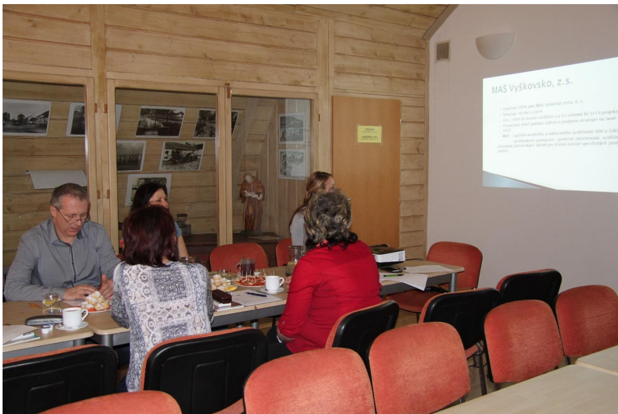
Obr. č. 12: Setkání pracovní skupiny Matematická gramotnost