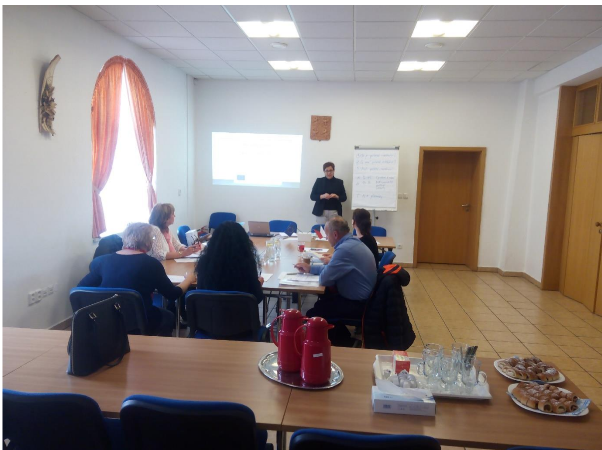
Obr. č. 11: Setkání pracovní skupiny Inkluze (v MŠ i ZŠ)